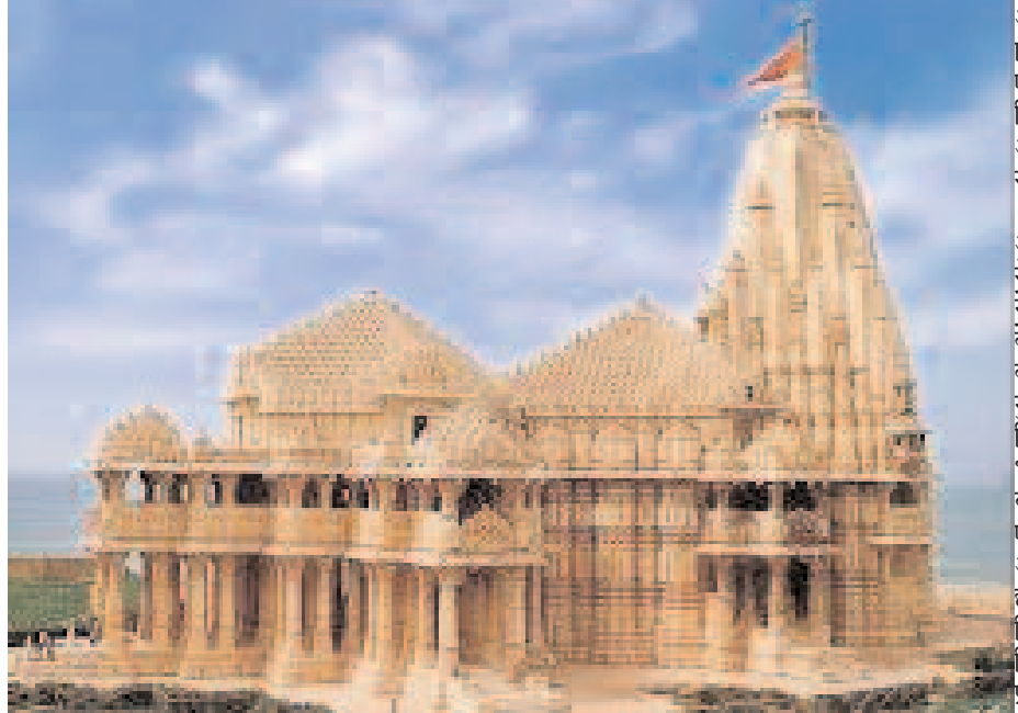
में हमेशा रोशनी होती है ह्म

उपराष्ट्रपति ने अपनी दिन भर की आध्यात्मिक यात्रा की शुरूआत पवित्र नागेश्वर ज्योतिर्लिंग, जोकि द्वारका का एक पावन मंदिर और भारत के 12 ज्योतिर्लिंगों में से एक है, के दर्शन के साथ की। उन्होंने दौरे के दौरान कहा कि पवित्र मंदिरों का दर्शन करने से हमारे भीतर हमेशा विनम्रता, आशा, सत्य एवं अच्छाई के विश्वास और करुणा का संचार होता है। उन्होंने कहा कि नागेश्वर ज्योतिर्लिंग की यह कथा, हमारे इस विश्वास को और अधिक मजबूत करती है कि बुराई पर हमेशा अच्छाई की जीत होगी। युवा पीढ़ी से हमारे इतिहास के ऐसे प्रतिष्ठित स्थलों की यात्रा करने का आग्रह करते हुए उन्होंने कहा कि इस तरह की यात्राएं और तीर्थयात्रा इस विश्वास को पुष्ट करते हैं कि हमारे सदियों पुराने सांस्कृतिक मूल्य और सभ्यतागत गुण हमें सही रास्ते पर ले जाते हैं। उन्होंने कहा, "हम यह अमूल्य सबक सीखते हैं कि परिस्थितियां चाहे कितनी भी कठिन क्यों न हों, सुरुंग के अंत