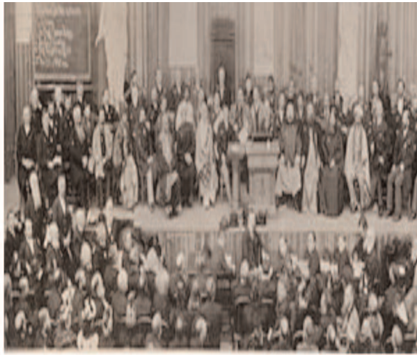
भाइयों एवं बहनों से की थी जिसके बाद सभागार में हर तरफ कई मिनटों

128 वर्ष पूर्व स्वामी विवेकानंद शिवांगी में विश्व धर्म सम्मेलन हुआ उस पर आज भी हम सभी भारतीय गर्व करते हैं स्वामी जी ने अपने भाषण की शुरुआत मेरे अमेरिकी