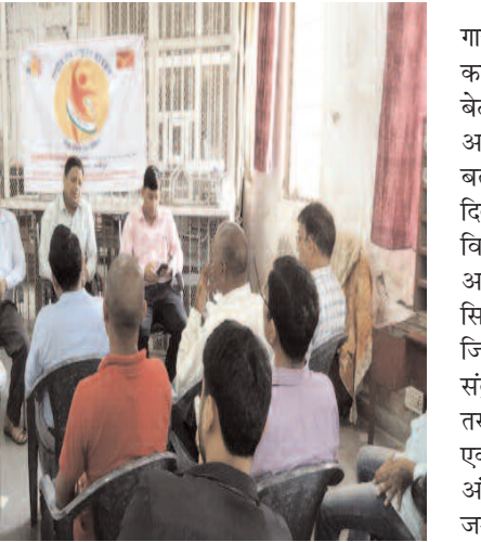
किया गया। उन्होंने बताया की मुख्य डाकघर के सभी डाक विभाग के कर्मचारियों को टी बी लक्ष्य, जांच, उपचार एवं बचाव के बारे बताया गया। क्षयरोग के प्रति जागरूक किया गया इसी क्रम में क्षयरोग से पीड़ित मरीजों को गोद लेने के लिए भी बताया गया। जिससे टीबी के मरीज जल्द से जल्द स्वस्थ हो सके। पोस्टल विभाग के सभी कर्मचारियों एवं अधिकारी एवं कर्मचारी उपस्थित थे।

गाजीपुर टीबी मुक्त भारत अभियान जो 2025 तक पूरा कर लेने का अभियान इन दिनों पूरे देश में चलाया जा रहा है। इसी को लेकर माननीय राष्ट्रपति द्रौपदी मुर्मू के द्वारा 9 सितंबर 2022 को शुरू किए गए प्रधानमंत्री टीबी मुक्त भारत अभियान के तहत भारत को टीबी मुक्त करने एवं टीबी से प्रसित रोगियों की देखभाल करने के लिए डाक विभाग के कर्मचारियों और अधिकारियों को आह्वान किया था। जिस के क्रम में सोमवार को मुख्य डाकघर महुआबाग में इस अभियान को लेकर बैठक किया गया जिसमें कई मुद्दों पर चर्चा की गई।