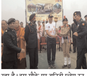
झारखंड बिहार जातिवाद में फंसा है । यह एकता में अखंडता के लिए ठीक नहीं है । जातिवाद से जब तक आगे नहीं निकलेगी देश आगे नहीं बढ़ेगा । यही संदेश लेकर यूनिटी प्लेम रन आगे बढ़ रहा है । जातिवाद से हम बाहर निकल जाएंगे तो देश काफी आगे बढ़ जाएगा । इसके अलावा उन्होंने एनसीसी कैडेट्स की होसला अफजाई किया । इस मौके पर एनसीसी की ओर से रंगा रंग कार्यक्रम को प्रस्तुति भी किया गया । जिसको सभी ने सराहा '

में 18 को मुकमल होगी । उन्होंने एनसीसी कैडेट्स को कहा कि देश में पहले से ही एकता में अखंडता का सिद्धांत कायम है । लेकिन