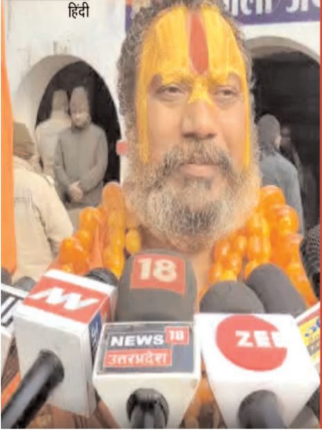
सामने आया उसको देखकर लगता है कि राहुल गांधी नहीं उनका हमशक्ल यही है.