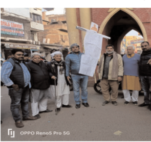
DPDP March Pro 10

के राज्य की प्रदर्शित होने वाले झांकी में विगत सात वर्षों से बिहार की झांकी को केंद्रीय चयन समिति द्वारा रिजेक्ट करना, बिहार एवम बिहारवासियों का घोर अपमान है,