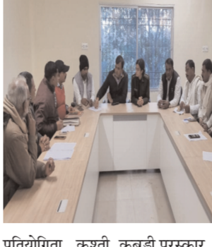
प्रतियोगिता , कुश्ती, कबड्डी पुरस्कार सह सम्मान समारोह तथा संस्कृति कार्यक्रम सह सम्मान समारोह आयोजित की जाएगी । अनुमंडल पदाधिकारी ने रात्रि 9:00 बजे तक

एवं कवि सम्मेलन का आयोजन किया जाएगा । वहीं कार्यक्रम के दूसरे दिन किंवद प्रतियोगिता, पेंटिंग