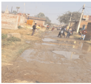
तक आवागमन करने में काफी कठिनाइयों का सामना करना पड़ता है । रोड की हालात इतना देनी है कि इस रोड से गुजरने वाले अधिकांश वाहन दुर्घटनाग्रस्त हो जाते हैं और

आए दिन घटना घटते रहती है और बराबर दुर्घटना होने की संभावना बनी रहती है । यहां के ग्रामीणों का कहना है कि कई बार हम लोग अधिकारी और जनप्रतिनिधि के पास आवेदन लेकर गए लेकिन कोई सुनने को तैयार नहीं है जब चुनाव की टाइटम होता है तो जनप्रतिनिधि बड़े-बड़े वादे करके चले जाते हैं, अभी तक कोई देखने वाला नहीं है और इस मार्ग से जिला मुख्यालय तक आवागमन करने वाले जनता बहुत परेशान है ।