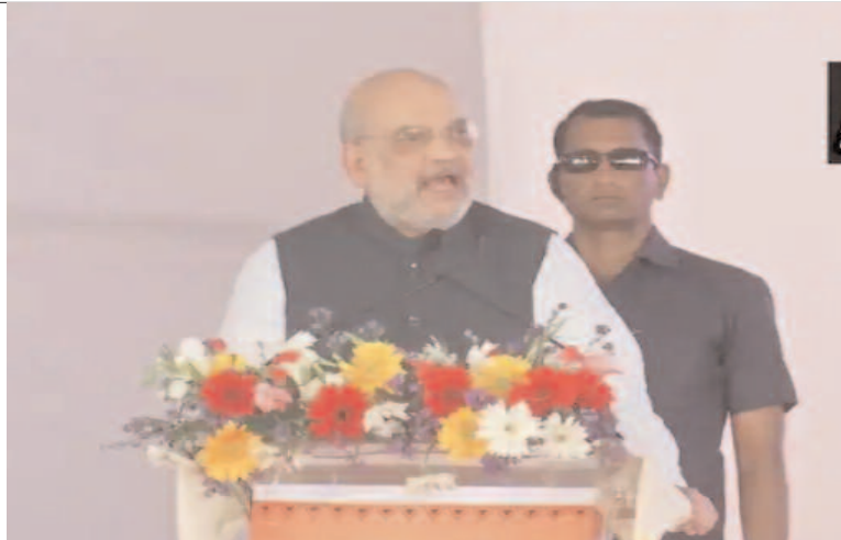
गोरता में हुई बर्बर घटना को याद करते हुए "क्रूर" निजाम ने 200 लोगों का नरसंहार कहा कि देश आजाद होने के बावजूद किया था. शाह ने कहा, "यहां गोरता में

केंद्रीय गृहमंत्री अमित शाह ने रविवार को कांग्रेस पर निशाना साधते हुए आरोप लगाया कि उसने उन लोगों को कभी याद नहीं किया, जिन्होंने "क्रूर" निजाम शासन से हैदराबाद की मुक्ति के लिए संघर्ष किया और अपने प्राणों की आहुति दी. जिले के गोरता गांव में गोरता शहीद स्मारक और देश के पहले गृहमंत्री दिवंगत सरदार वल्लभभाई पटेल की प्रतिमा का उद्घाटन करने के बाद एक जनसभा को संबोधित करते हुए शाह ने दावा किया कि मुख्यमंत्री के. चंद्रशेखर राव के नेतृत्व वाली तेलंगाना सरकार आज भी हैदराबाद मुक्ति दिवस मनाने में "हिचकती" है.