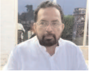
को लोकसभा सदस्यता समाप्त किये