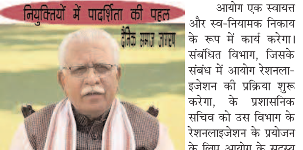
नियुक्तियों में पादांशिता की पहल आयोग एक स्वायत्त और स्व-नियामक निकाय के रूप में कार्य करेगा। संबंधित विभाग, जिसके संबंध में आयोग रेशनललाइजेशन की प्रक्रिया शुरू करेगा, के प्रशासनिक सचिव को उस विभाग के रेशनललाइजेशन के प्रयोजन के लिए आयोग के सदस्य के रूप में सहयोजित माना जाएगा। वह संबंधित विभाग के रेशनललाइजेशन के उद्देश्य से आयोग के विचार-विमर्श में पूरी तरह से भाग लेगा।

कृष्ण राज अरुण चंडीगढ़ /सीपी एच हैड -दैनिक समाज जागरण-/ हरियाणा सरकार ने अगले 6 महीने के लिए रेशनललाइजेशन आयोग का निर्माण कर दिया है। हरियाणा सरकार ने यह आयोग राजन गुप्त की अध्यक्षता में गठित रेशनललाइजेशन आयोग की संरचना और कार्यक्षेत्र के बारे में नोटिफिकेशन जारी कर दिया है। आयोग के अध्यक्ष की नियुक्ति 6 महीने की अवधि के लिए की जाएगी। यह भी है कि उनका कार्यकाल राज्य सरकार के विवेक पर 3 महीने के लिए और अधिक अवधि के लिए