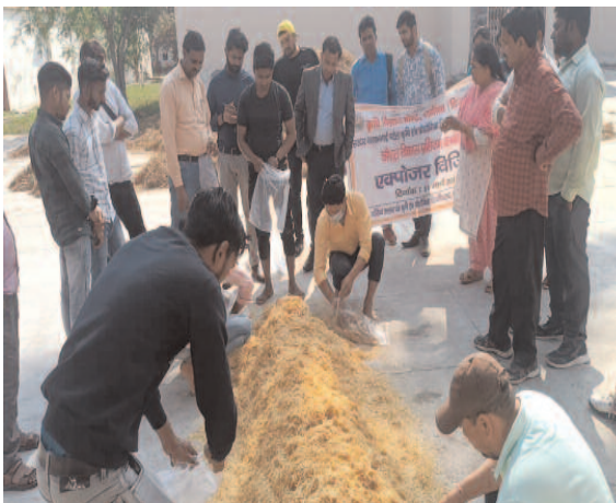
के बारे में भी विजिट करा करके दिखाया गया उपरोक्त 26 दिनों के प्रशिक्षण कार्यक्रम में गोविंद बल्लभ पंत