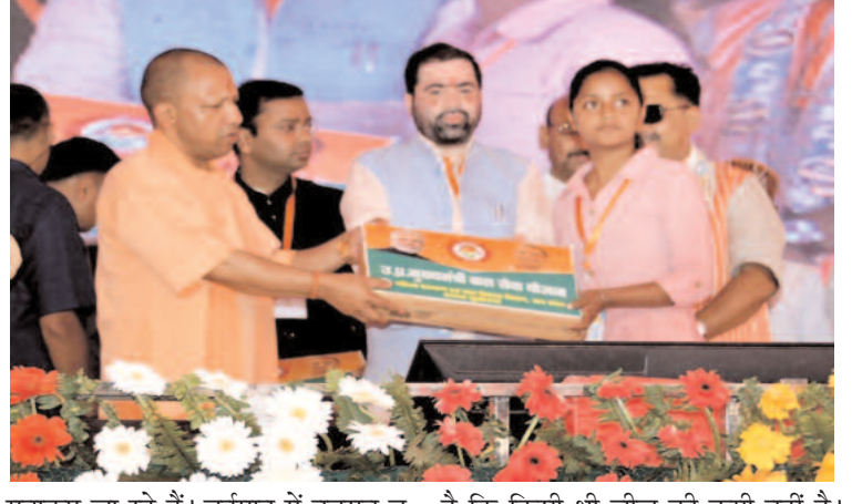
मनाए जा रहे हैं। वर्तमान में नवरात्र व रमजान एक साथ चल रहे हैं लेकिन कहीं भी कोई हलचल नहीं है।

सीएम योगी बुधवार को कुशीनगर जिले के खड्डा स्थित गांधी किसान इंटर कॉलेज आयोजित शिलान्यास-लोककार्पण समारोह को संबोधित कर रहे थे। इस दौरान जनपद को सौगत देते हुए उन्होंने 451 करोड़ रुपये की लागत वाली 106 विकास परियोजनाओं का शिलान्यास व लोककार्पण किया। समारोह में मुख्यमंत्री ने सभी लोगों को चैत्र नवरात्र व श्रीराम नवमी की बधाई देते हुए कहा कि यह वही प्रदेश है जहाँ पहले विकास का पैसा चंद लोगों की जेब में चला जाता था यहाँ तक कि राशन भी चंद लोगों की जेब में ही जाता था। पूर्व-त्वहार आते ही दंगों के भय से लोग घरों से बाहर नहीं निकलते थे। शासन-प्रशासन पर्वों को प्रतिबंधित कर देता था। आज उत्साह व उमंग के साथ हर पर्व व त्योहार