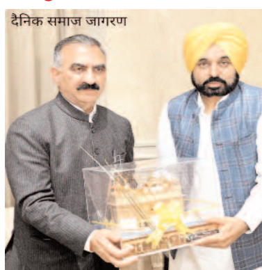
समाज जागरण चंडीगढ़- मुख्यमंत्री ठाकुर सुखविंदर सिंह सुक्खू को चंडीगढ़ में श्री हरमिंदर साहिब की प्रतिकृति भेंट करते पंजाब के मुख्यमंत्री भगवंत मान।