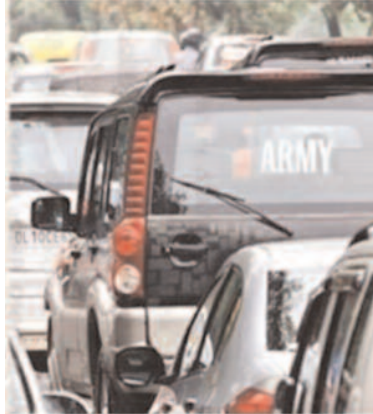
इस कार्यवाही से साफ संकेत है कि आने वाले दिनों में पुलिस इस कदम पर बड़ी कार्रवाई भी कर सकती है।