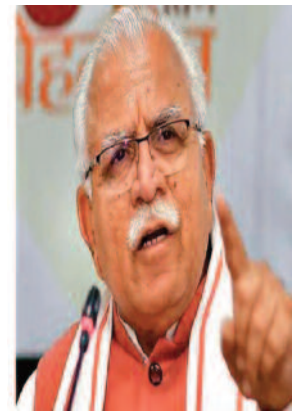
कॉलोनियों को लेकर CM एक्शन में मनोहर लाल खट्टर ने साफ

कृष्ण राज अरुण चंडीगढ़ /सीपी एच हैड - दैनिक समाज जागरण हरियाणा में सीएम हाउस में लगातार आ रही शिकायतों को देखते हुए मुख्यमंत्री मनोहर लाल खट्टर ने अवैध कॉलोनियों पर तगड़ा एक्शन लेते हुए बड़ा फैसला लेकर रजिस्ट्रेशन पर रोक लगा दी है। इस कार्यवाही के चलते पानीपत नगर निगम के जोनल टैक्स ऑफिसर को किया गया है सस्पेंड।