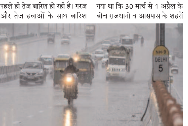
पहले ही तेज बारिश हो रही है। गरज और तेज हवाओं के साथ बारिश गया था कि 30 मार्च से 1 अप्रैल के बीच राजधानी व आसपास के शहरों का मौसम बदलेगा। इस दौरान राजधानी में बिजली गिरने, गरज और तेज हवाओं के साथ बारिश और गरज के छोटें पड़ने की संभावना व्यक्त की गई थी।

कृष्ण राज अरुण -दैनिक समाज जागरण- नई (राजधानी दिल्ली डेस्क)-खबरों में मौसम विभाग ने कहा है कि दिल्ली-उत्तराखण्ड मौसम एक बार फिर बदल गया है। शाम होते ही दिल्ली-नोएडा के कई इलाकों में तेज बारिश शुरू है। मौसम की हकीकत माने तो एनड मार्च के महीने में अब तक दिल्ली में मौसम के कई रंग देखने को मिल चुके हैं।