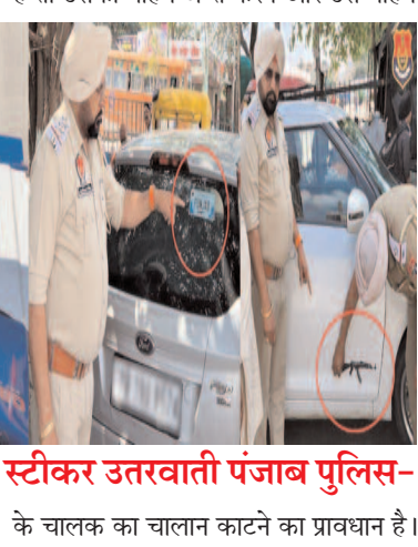
गड़ियों में स्टीकर उतरवाती पंजाब पुलिस-

सहयोग करना है। CRPF सबसे अधिक पसंदीदा पैरामिलिट्री नौकरी (Sarkari Naukri) में से एक माना जाता है। अगर आप भी उच्छ्क्रम में नौकरी (CRPF Job) करने की चाहत रखते हैं, तो CRPF SI Salary और जॉब प्रोफाइल के बारे में जरूर जानना चाहिए, उच्छ्क्रमक पद के लिए चयनित उम्मीदवारों को सर्विस के दौरान कई लाभ और भत्ते भी मिलते हैं। CRPF रक के लिए आवश्यक