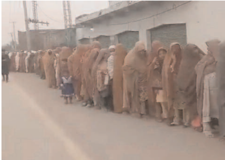
लेने के प्रयास में चार बुजुर्गों की मौत हो गई और कई बेहोश हो गए. उन्होंने कहा

लाहौर. आर्थिक तंगी के बीच पाकिस्तान की जनता में हाहाकार मचा है. आटा लेने के लिए लंबी लाइनें लगी रही हैं. पाकिस्तान के पंजाब प्रांत में पिछले कुछ दिनों में सरकारी वितरण केंद्रों से मुफ्त आटा लेने की कोशिश के दौरान कम से कम चार बुजुर्गों की मौत हो गई. अधिकारियों ने शनिवार को यह जानकारी दी. आसमान छूती महंगाई से निपटने के लिए विशेष रूप से पंजाब प्रांत में गरीबों के लिए मुफ्त आटा योजना शुरू की गई थी. इसका लाभ उठाने के लिए सरकारी वितरण केंद्रों पर भीड़ उमड़ पड़ी और कई लोगों की मौत हो गई.