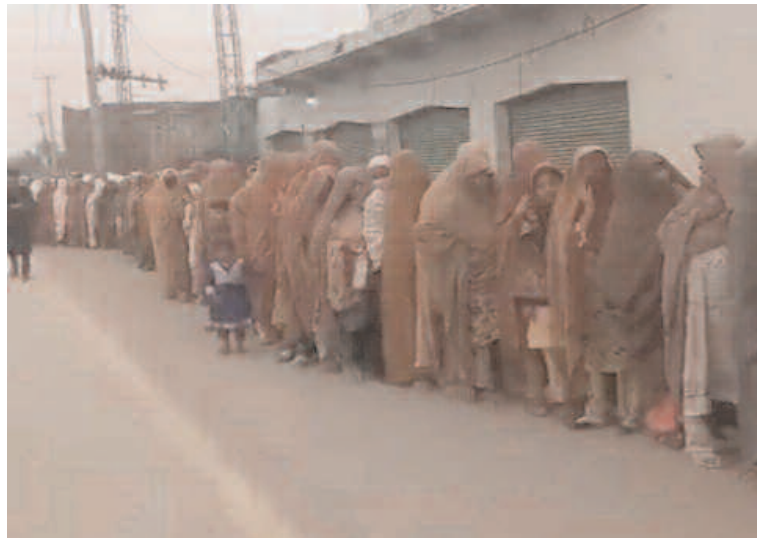
लेने के प्रयास में चार बुजुर्गों की मौत हो गई और कई बेहोश हो गए. उन्होंने कहा

लाहौर. आर्थिक तंगी के बीच पाकिस्तान की जनता में हाहाकार मचा है. आटा लेने के लिए लंबी लाइनें लगी रही हैं. पाकिस्तान के पंजाब प्रांत में पिछले कुछ दिनों में सरकारी वितरण केंद्रों से मुफ्त आटा लेने की कोशिश के दौरान कम से कम चार बुजुर्गों की मौत हो गई. अधिकारियों ने शनिवार को यह जानकारी दी. आसमान छूती महंगाई से निपटने के लिए विशेष रूप से पंजाब प्रांत में गरीबों के लिए मुफ्त आटा योजना शुरू की गई थी. इसका लाभ उठाने के लिए सरकारी वितरण केंद्रों पर भीड़ उमड़ पड़ी और कई लोगों की मौत हो गई.