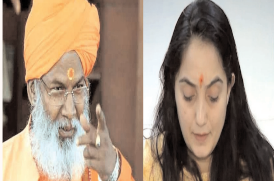
हिंदू भी बहिष्कार पर उतर आए तो मुसलमानों को रोटी के लाले पड़ जाएंगे.

भाजपा के फायरब्रांड नेता और उन्नाव सांसद साक्षी महाराज भी भाजपा की पूर्व प्रवक्ता नूपुर शर्मा के बचाव में उतर आए हैं. उन्होंने सुप्रीम कोर्ट द्वारा नूपुर शर्मा के बयान पर दी गई टिप्पणी पर भी अपना पक्ष रखा. उन्होंने स्पष्ट कहा कि नूपुर शर्मा के बयान पर टिप्पणी देने में सुप्रीम कोर्ट ने जल्दबाजी की. नूपुर शर्मा के बयान के बाद अजमेर में बढ़ते तनाव पर भी साक्षी महाराज ने जमकर आवाज उठाई. उन्होंने कहा कि अजमेर में मुसलमानों की तर्ज पर हिंदुओं ने भी आर्थिक बहिष्कार कर दिया, तो मुस्लिम समाज को रोटी के लाले पड़ जाएंगे.