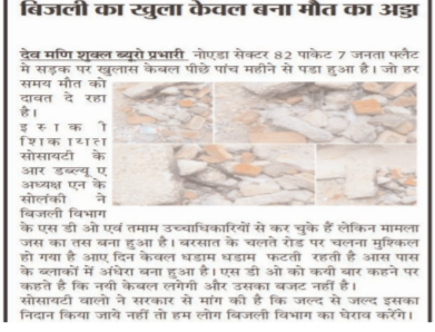
बिजली का खुला केबल बना गैर का अड्डा