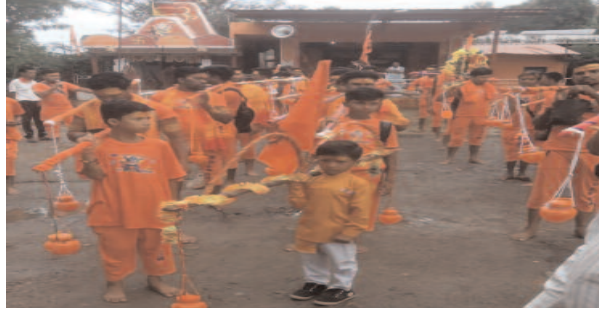
समाज जागरण/शिवशंकर पाण्डेय जिला ब्यूरो

बिरसा/बालाघाट त्सावन के दूसरे सोमवार को कावड़ियों का जत्था बिरसा के बंजर नदी से जल भरकर भोरमदेव जाकर जलाभिषेक करने के लिए रवाना हो चुके है जिसमे क्षेत्र के युवाओं के द्वारा बड़े धूमधाम से कांवड़ यात्रा निकाली गयी जिसमे बड़ी संख्या में ग्रामीणों ने हिस्सा लिया। इस दौरान महिलाओं और पुरुषों ने बिरसा स्थित प्राचीन पिपलेश्वर महादेव मंदिर पहुंच कर