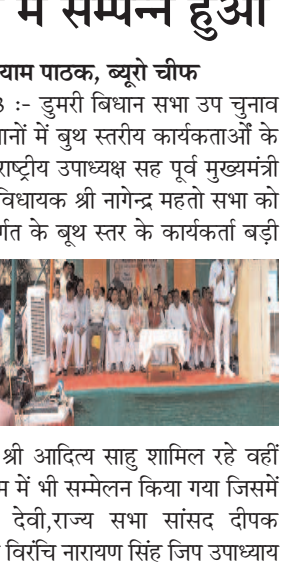
गिरिडीह (झारखंड) 29 अगस्त 2023 :- डुमरी विधान सभा उप चुनाव को लेकर भारतीय जनता पार्टी ने दो स्थानों में बुध स्तरीय कार्यकर्ताओं के साथ सम्मेलन किया जिसमें भाजपा के राष्ट्रीय उपाध्यक्ष सह पूर्व मुख्यमंत्री श्री रघुवर दास जी के साथ बगोदर पूर्व विधायक श्री नान्देन्द्र महतो सभा को संबोधित किए। जिसमें डुमरी मंडल अंतर्गत के बृथ स्तर के कार्यकर्ता बड़ी संख्या में सम्मिलित होकर 5 सितंबर को केला छाप पर एनडीए प्रत्याशी श्री मती यशोदा देवी जी को प्रचंड बहुमत से जीत दिलाने का आह्वान किया। इस कार्यक्रम में मुख्य रूप से भाजपा राष्ट्रीय उपाध्यक्ष सह झारखंड प्रभारी श्री लक्ष्मी कंत बाजपेई जी प्रदेश महामंत्री श्री आदित्य साहू शामिल रहे वहीं दूसरी तरफ चन्द्रपुरा प्रखण्ड के तेलो ग्राम में भी सम्मेलन किया गया जिसमें केन्द्रीय शिक्षा राज्य मंत्री अन्नपूर्णा देवी, राज्य सभा सांसद दीपक प्रकाश, विधायक दामोदर महतो, विधायक विरंचि नारायण सिंह जिन उपाध्याय छोटेलाल यादव, दिनेश यादव समेत सैकड़ों की संख्या में उपस्थित थे।

दैनिक समाज जागरण गिरिडीह (झारखंड) 29 अगस्त 2023 :- डुमरी विधान सभा उप चुनाव को लेकर भारतीय जनता पार्टी ने दो स्थानों में बुध स्तरीय कार्यकर्ताओं के साथ सम्मेलन किया जिसमें भाजपा के राष्ट्रीय उपाध्यक्ष सह पूर्व मुख्यमंत्री श्री रघुवर दास जी के साथ बगोदर पूर्व विधायक श्री नान्देन्द्र महतो सभा को संबोधित किए। जिसमें डुमरी मंडल अंतर्गत के बृथ स्तर के कार्यकर्ता बड़ी संख्या में सम्मिलित होकर 5 सितंबर को केला छाप पर एनडीए प्रत्याशी श्री मती यशोदा देवी जी को प्रचंड बहुमत से जीत दिलाने का आह्वान किया। इस कार्यक्रम में मुख्य रूप से भाजपा राष्ट्रीय उपाध्यक्ष सह झारखंड प्रभारी श्री लक्ष्मी कंत बाजपेई जी प्रदेश महामंत्री श्री आदित्य साहू शामिल रहे वहीं दूसरी तरफ चन्द्रपुरा प्रखण्ड के तेलो ग्राम में भी सम्मेलन किया गया जिसमें केन्द्रीय शिक्षा राज्य मंत्री अन्नपूर्णा देवी, राज्य सभा सांसद दीपक प्रकाश, विधायक दामोदर महतो, विधायक विरंचि नारायण सिंह जिन उपाध्याय छोटेलाल यादव, दिनेश यादव समेत सैकड़ों की संख्या में उपस्थित थे।