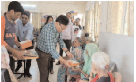
गोपनीय रहती है। इसके अलावा यदि वृद्धजन मतदान केन्द्र पर जाकर मतदान करना चाहते हैं तो उन्हें वाहन के माध्यम से घर से मतदान केन्द्र तक लाने और मतदान के बाद वापस घर तक छोड़ने की सुविधा प्रदान की जाती है। मतदान केन्द्रों पर व्हील चेयर, पेयजल, बैठक व्यवस्था सहित सभी व्यवस्थाएं रहती हैं।