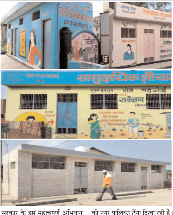
सरकार के इस महत्वपूर्ण अभियान को नगर पालिका ठेगा दिखा रही है।

दैनिक समाज जागरण बहजोई/संभल स्वच्छ भारत मिशन अभियान के अंतर्गत बनाए गए शौचालय में ताले लटके हुए हैं एक तरफ सरकार स्वच्छता अभियान को चलाकर साफ सफाई पर विशेष ध्यान दे रही है तो वहीं दूसरी ओर नगर पालिका परिषद बहजोई द्वारा नगर में बनाए गए शौचालय में ताले लटके हुए हैं मामला जनपद संभल के नगर पालिका परिषद बहजोई का सामने आया है वार्ड नंबर 22 काली मंदिर के निकट मिनी स्टेडियम के पास बने सार्वजनिक शौचालय में ताले लटके हुए हैं जबकि शौचालय पूर्ण रूप से सही है शौचालय में ताले लगे होने से लोगों को परेशानी का सामना करना पड़ रहा है शौचालय में लगे हुए ताले से लग रहा है की नगर पालिका परिषद सरकार द्वारा चलाए जा रहे स्वच्छ भारत मिशन अभियान में दिलचस्पी नहीं दिख रही