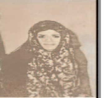
ए मुखियाजी, कांग्रेस ने 1954 में विशेष विवाह अधिनियम लागू किया ताकि

सनातनियों के विरुद्ध और पुनः मुगल राज स्थापित करने के उद्देश्य से कांग्रेस ने 1995 में "वक्कत बोर्ड एक्ट" पास किया। जिसके आधार पर बोर्ड, देश में किसी भी जमीन को अपना घोषित कर सकता