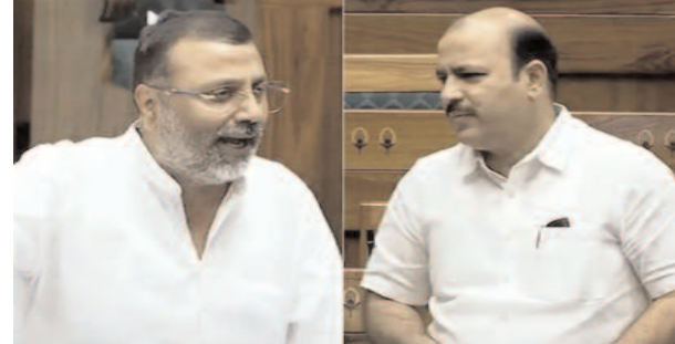
टिप्पणी की है. उन्होंने इसकी जांच कराने की मांग की.

दिल्ली. संसद के विशेष सत्र के आखिरी दिन लोकसभा में बीजेपी सांसद रमेश बिधूड़ी द्वारा बीएसपी सांसद दानिश अली के लिए आपत्तिजनक शब्दों का इस्तेमाल किए जाने के बाद सियासी भूचाल मचा है. विपक्ष बीजेपी सांसद रमेश बिधूड़ी पर कार्रवाई की मांग कर रहा है. इसी बीच बीजेपी के सांसद निशिकांत दुबे ने भी इस मामले में जांच की मांग की है. भाजपा सांसद निशिकांत दुबे ने लोकसभा अध्यक्ष ओम बिरला को पत्र लिखकर कहा है कि बसपा सांसद दानिश अली ने पीएम मोदी के खिलाफ एक बेहद आपत्तिजनक और अपमानजनक