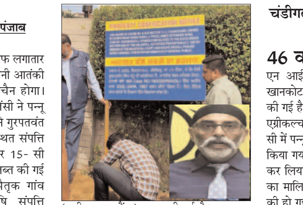
(एग्रीकल्चर लैंड) जब्त की गई है।