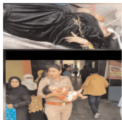
जा रहे थे गाव मुरलीवाला ओम इंटर कॉलेज के