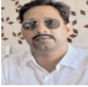
छलक रहा है कि यह महागठबंधन की सरकार हिंदू विरोधी सरकार है। चाचा-भतीजे की मिलीभगत सरकार

अररिया। सूबे के महागठबंधन सरकार द्वारा अल्पसंख्यक टुट्टीकरण नीति के तहत सनातनी संस्कृति के तहत त्योहारों पर सरकारी अवकाश रद्द करना दुर्भाग्यपूर्ण निर्णय है, किसी खास समुदाय को खुश करने की चक्कर में चाचा-भतीजे की सरकार मिलकर सूबे की शिक्षा व्यवस्था व सनातन संस्कृति को नष्ट करना चाह रही है। आने वाले समय में जनता द्वारा इसका सही जवाब दिया जायेगा। कुर्सी कुमार की नीयत साफ