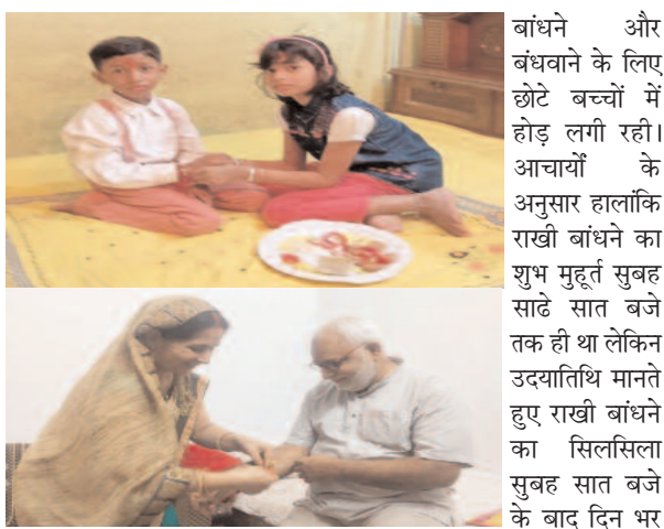
काफी उत्साह देखने को मिला, राखी चलता रह।

मुख्य बाजारों में काफी संख्या में लोगों के आवागमन से कभी कभी घण्टों तक जाम की स्थिति का सामना करना पड़ा। रक्षाबन्धन के पवित्र त्योहार पर छोटे बच्चों में