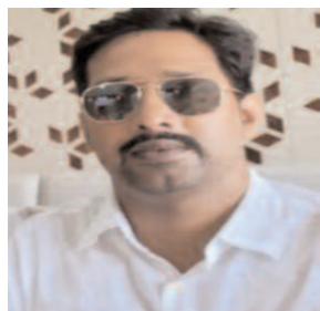
छलक रहा है कि यह महागठबंधन की सरकार हिंदू विरोधी सरकार है। चाचा-भतीजे की मिलीभगत सरकार है।

अररिया। सूबे के महागठबंधन सरकार द्वारा अल्पसंख्यक तुष्टीकरण नीति के तहत सनातनी संस्कृति के तहत त्योहारों पर सरकारी अवकाश रद्द करना दुर्भाग्यपूर्ण निर्णय है। किसी खास समुदाय को खुश करने की चक्कर में चाचा-भतीजे की सरकार मिलकर सूबे की शिक्षा व्यवस्था व सनातन संस्कृति को नष्ट करना चाह रही है। आने वाले समय में जनता द्वारा इसका सही जवाब दिया जायेगा। कुर्सी कुमार की नीयत साफ