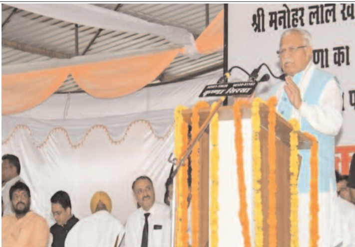
सिरसा पहुंचे मुख्यमंत्री मनोहर लाल बार एसोसिएशन के समारोह में बकीलों को संबोधित करते हुए

बताया गया है कि मुख्यमंत्री मनोहर लाल खट्टर द्वारा हरियाणा में यह कार्यक्रम समाज में फैल रही नशे जैसी सामाजिक बुराई