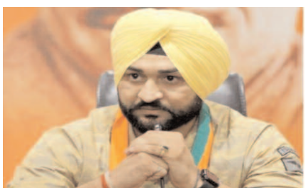
संदीप सिंह के मामले में धारा- 509 भी जोड़ी गई

चण्डीगढ़, 5 सितम्बर:। हरियाणा की एक जूनियर महिला कोच के साथ छेड़छाड़ और उत्पीड़न मामले में आरोपी हरियाणा के मंत्री संदीप सिंह ने अब चंडीगढ़ कोर्ट के समक्ष अग्रिम जमानत याचिका दाखिल की है। मसलन, मंत्री संदीप सिंह को मामले में गिरफ्तारी की आशंका लग रही है। यहाँ यह उल्लेख करना भी जरूरी है कि, चंडीगढ़ पुलिस ने पिछले साल दिसम्बर में जूनियर महिला कोच की शिकायत पर संदीप सिंह के खिलाफ आईपीसी की 354, 354ए, 354बी, 342 और 506 जैसी गंभीर धाराओं में मामला दर्ज किया था और जांच शुरू कर दी थी। चंडीगढ़ पुलिस की स्पेशल इन्वेस्टीगेशन टीम इस पूरे मामले को देख रही है क्योंकि यह मामला काफी हाईप्रोफाइल है। पुलिस टीम मामले को लेकर मंत्री संदीप सिंह से पहले घंटों पूछताछ भी कर चुकी है। इसके साथ ही कोर्ट में संदीप सिंह के खिलाफ चार्जशीट भी दाखिल की जा चुकी है। वहीं कोर्ट से संदीप सिंह को मामले में नोटिस भी जारी किया जा चुका है।