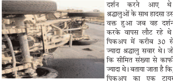
सभी श्रद्धालु उत्तर प्रदेश के रहने वाले