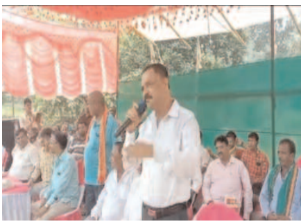
समस्याओं के साथ खड़ा हैं। लोगों ने उनकी काम की सराहना करते हुए अपने ओर से धन्यवाद दिया।