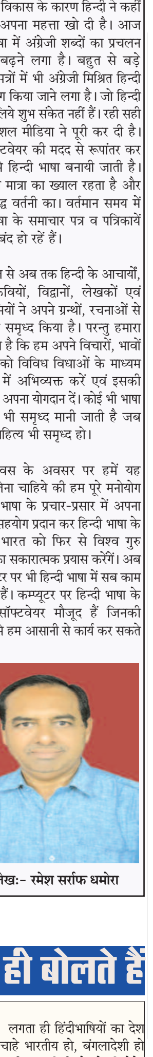
आलेख:- रमेश सर्राफ धमोरा

एक साथ विकास के कारण हिन्दी ने कहीं ना कहीं अपना महत्ता खो दी है। आज हिन्दी भाषा में अंग्रेजी शब्दों का प्रचलन तेजी से बढ़ने लगा है। बहुत से बड़े समाचार पत्रों में भी अंग्रेजी मिश्रित हिन्दी का उपयोग किया जाने लगा है। जो हिन्दी भाषा के लिये शुभ संकेत नहीं हैं। रही सही कसर सोशल मीडिया ने पूरी कर दी है। जहां सॉफ्टवेयर की मदद से रूपांतर कर अंग्रेजी से हिन्दी भाषा बनायी जाती है। जिसमें ना मात्रा का ख्याल रहता है और ना ही शुद्ध वर्तनी का। वर्तमान समय में हिन्दी भाषा के समाचार पत्र व पत्रिकायें घड़ाघड़ बंद हो रहें हैं। आदिकाल से अब तक हिन्दी के आचार्यों, सन्तों, कवियों, विद्वानों, लेखकों एवं हिन्दी-प्रेमियों ने अपने ग्रन्थों, रचनाओं से हिन्दी को समृद्ध किया है। परन्तु हमारा भी कर्तव्य है कि हम अपने विचारों, भावों एवं मतों को विविध विधाओं के माध्यम से हिन्दी में अभिव्यक्त करें एवं इसकी समृद्धि में अपना योगदान दें। कोई भी भाषा तब और भी समृद्ध मानी जाती है जब उसका साहित्य भी समृद्ध हो। हिन्दी दिवस के अवसर पर हमें यह संकल्प लेना चाहिये की हम पूरे मनोयोग से हिन्दी भाषा के प्रचार-प्रसार में अपना निस्वार्थ सहयोग प्रदान कर हिन्दी भाषा के बल पर भारत को फिर से विश्व गुरु बनवाने का सकारात्मक प्रयास करेंगे। अब तो कम्प्यूटर पर भी हिन्दी भाषा में सब काम होने लगे हैं। कम्प्यूटर पर हिन्दी भाषा के अनेकों सॉफ्टवेयर मौजूद हैं जिनकी सहायता से हम आसानी से कार्य कर सकते हैं।