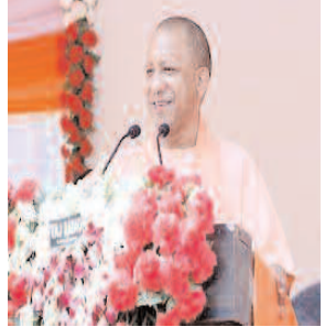
की अध्यक्षता में आज केंद्रीय कैबिनेट द्वारा 'प्रधानमंत्री उज्वला योजना' के अंतर्गत रसीई गैस पर सब्सिडी को 200 से बढ़ाकर 300 करने का निर्णय अभिनंदनीय है।

लखनऊ, 4 अक्टूबर। मुख्यमंत्री योगी आदित्यनाथ ने केंद्र सरकार द्वारा उज्वला योजना की सब्सिडी बढ़ाए जाने पर हर्ष व्यक्त करते हुए इसे नवरात्रि से पहले मातृ शक्ति को प्रधानमंत्री नरेंद्र मोदी की ओर से दिया गया उपहार बताया। उन्होंने केंद्र सरकार के इस निर्णय को अभिनंदनीय बताते हुए अपने सोशल मीडिया एक्स के अकाउंट से प्रधानमंत्री नरेंद्र मोदी का आभार प्रकट किया। मुख्यमंत्री ने सोशल मीडिया पर लिखा कि महिला कल्याण एवं गरीबों के उत्थान के लिए प्रतिबद्ध प्रधानमंत्री नरेंद्र मोदी