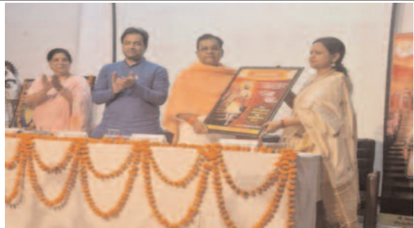
को छिपाया गया, हमारे महापुरुषों के त्याग और बलिदान की गाथाएं हमारे सामने नहीं आ सकी, इसी दिशा में यह एक प्रयास है। आजकल हम