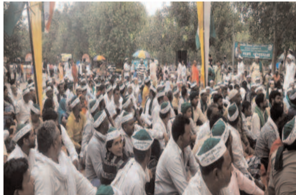
का भारी नुकसान हुआ है उनका सर्वे करवा के किसानों का संपूर्ण कर्ज माफ किया जाए किसानों को 60 वर्ष के बाद रुपए 10000