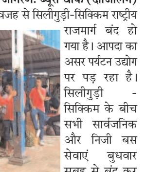
राजमार्ग बंद हो गया है। आपदा का असर पर्यटन उद्योग पर पड़ रहा है। सिलीगुड़ी - सिक्किम के बीच सभी सार्वजनिक और निजी बस सेवाएं बुधवार सुबह से बंद कर दी गई है। इससे सिलीगुड़ी आने वाले पर्यटक, श्रमिक व यात्री परेशान है। एनजेपी स्टेशन पर कई पर्यटक, श्रमिक व यात्री फंसे हुए है। छोटे वाहन यात्रियों को वैकल्पिक सड़कों से ले जाने के लिए दोगुना किराया ले रहे है हालांकि कुछ लोगों के लिए यह संभव है, लेकिन श्रमिकों के लिए अतिरिक्त किराया देना संभव नहीं है। नतीजतन वे स्टेशन पर अटक हुए है। इस बीच, कई लोग जरूरी काम से सिक्किम जाने के लिए मंगलवार को सिलीगुड़ी पहुंचे थे। सुबह आपदा की खबर सुनकर वे चिंतित है।

उत्तम सिंह: संवाददाता: दैनिक समाज जागरण: ब्यूरो चीफ (दार्जिलिंग) सिक्किम में आए प्राकृतिक आपदा की वजह से सिलीगुड़ी-सिक्किम राष्ट्रीय राजमार्ग बंद हो गया है। आपदा का असर पर्यटन उद्योग पर पड़ रहा है। सिलीगुड़ी - सिक्किम के बीच सभी सार्वजनिक और निजी बस सेवाएं बुधवार सुबह से बंद कर दी गई है। इससे सिलीगुड़ी आने वाले पर्यटक, श्रमिक व यात्री परेशान है। एनजेपी स्टेशन पर कई पर्यटक, श्रमिक व यात्री फंसे हुए है। छोटे वाहन यात्रियों को वैकल्पिक सड़कों से ले जाने के लिए दोगुना किराया ले रहे है हालांकि कुछ लोगों के लिए यह संभव है, लेकिन श्रमिकों के लिए अतिरिक्त किराया देना संभव नहीं है। नतीजतन वे स्टेशन पर अटक हुए है। इस बीच, कई लोग जरूरी काम से सिक्किम जाने के लिए मंगलवार को सिलीगुड़ी पहुंचे थे। सुबह आपदा की खबर सुनकर वे चिंतित है।