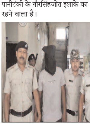
खोरीबारी थाना पुलिस से मिली जानकारी के अनुसार, गुप्त सूचना के आधार पर खोरीबाड़ी-गलगलिया

दैनिक समाज जागरण संवाददाता खोरीबारी (दार्जिलिंग)। खांसी के रूप इस्तेमाल की जाने वाली कफ सिरप बाजार में उपलब्ध है। जिसे देते समय विक्रेता डॉक्टर की पर्ची देखने की जहमत भी नहीं उठाते हैं। वहीं वर्तमान पीढ़ी के युवा भी अधिक पैसे कमाने की लालच में ड्रग्स कारोबारियों के चंगुल में फंसकर अपनी जिंदगी बर्बाद कर लेते हैं।