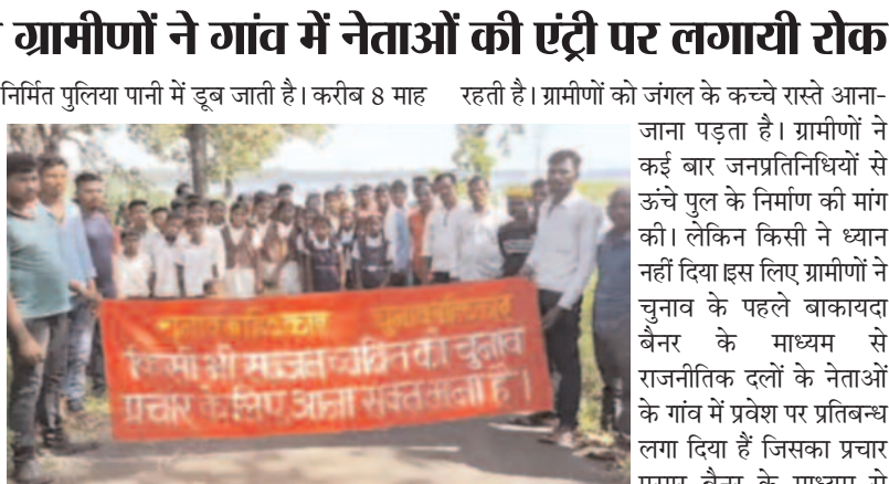
पुलिया जलमन रहती है, जिस कारण खैरलांजी से अंबेझरी मुख्य सड़क मार्ग से आवाजाही बंद