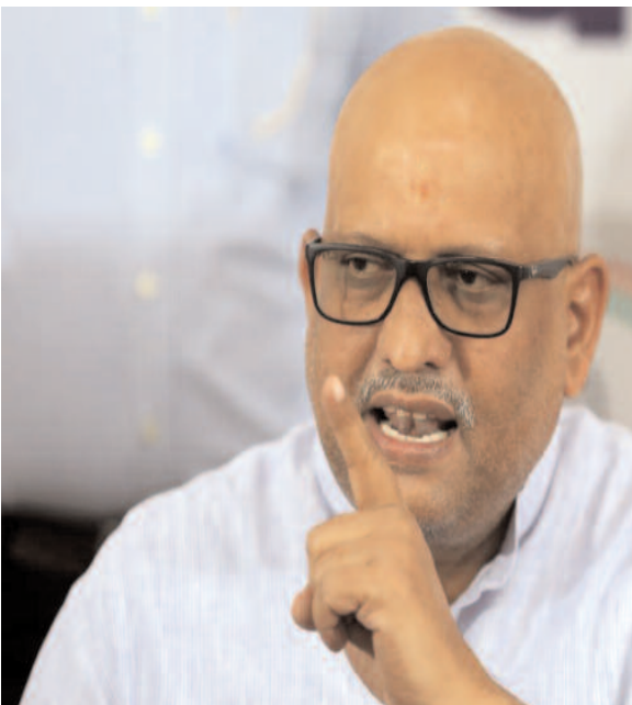
भाजपा सरकार ने इस मौसमी संक्रमण और बीमारी से लड़ने की कोई तैयारी नहीं की। जबकि प्रतिवर्ष

प्रदेश कांग्रेस अध्यक्ष अजय राय जी ने कहा