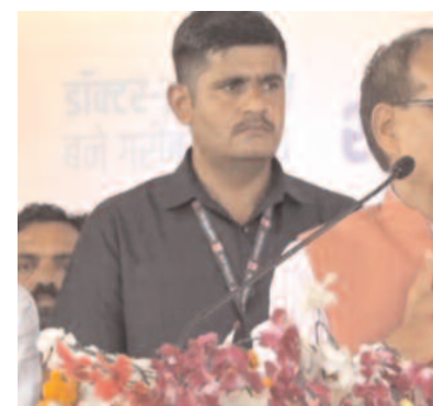
भी जनता सड़कों पर खड़ी थी और हर जगह भैया, मामा कह रही थी। जनता का प्यार देखकर, मेरा तो जीवन धन्य हो गया। सीएम शिवराज ने अपनी सरकार को उपलब्धियों

भोपाल/सीहोर। मुख्यमंत्री शिवराज सिंह चौहान रविवार को सीहोर के जहाजपुर ग्राम पहुंचे। यहां पहुंचकर उन्होंने करीब 10 करोड़ रुपये के विकास कार्यों का भूमिपूजन किया। सीएम शिवराज यहां जनता के बीच पहुंचकर भावुक हो गए और उन्होंने कहा कि मैं अपने आप को बड़ा सौभाग्यशाली मानता हूँ कि मध्य प्रदेश की जनता से मुझे हमेशा एक परिवार के सदस्य की तरह प्यार मिला और इस प्यार का कर्ज मरते दम तक उनकी सेवा करके चुकाता रहूंगा। यह मेरा वादा है। सीएम शिवराज ने कार्यक्रम के मंच से लोगों को संबोधित करते हुए कहा कि जहाजपुरा वालों, तुमने पुकारा और मैं चला आया। आपके इस प्यार पर जिंदगी न्योछावर है। मध्यप्रदेश की जनता से मेरा अद्भुत रिश्ता है। मैंहर से जबलपुर कल रात (शनिवार को) बाय रोड गया, तो आधी रात को