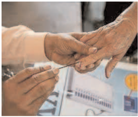
आयोग द्वारा पांचों नगर निगमों में चुनाव को लेकर जल्द ही शेड्यूल जारी किया जाएगा।