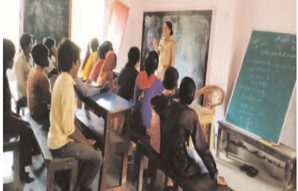
181 साइबर हेल्पलाइन 1930/155260 मुख्यमंत्री हेल्पलाइन नंबर 1076 तथा थाने पर गठित महिला हेल्प डेस्क इत्यादि

योजनाओं जैसे सुकन्या सुमंगला योजना अल्पदि के बारे में बताया गया तथा बच्चों को गुड टच व बैड टच के बारे में बताया