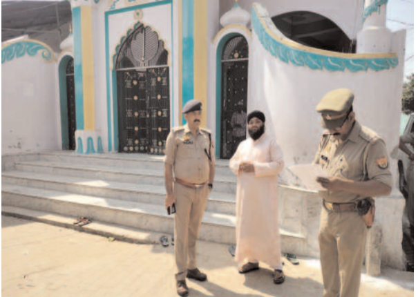
मं प्रदर्शन की आशंका के चलते हाई अलर्ट जारी किया गया है। किसी प्रकार का माहौल न बिगड़े

नजर रखते हुए पुलिस अलर्ट है। हालांकि पाली में शांतिपूर्ण तरीके से नमाज अदा हुई।