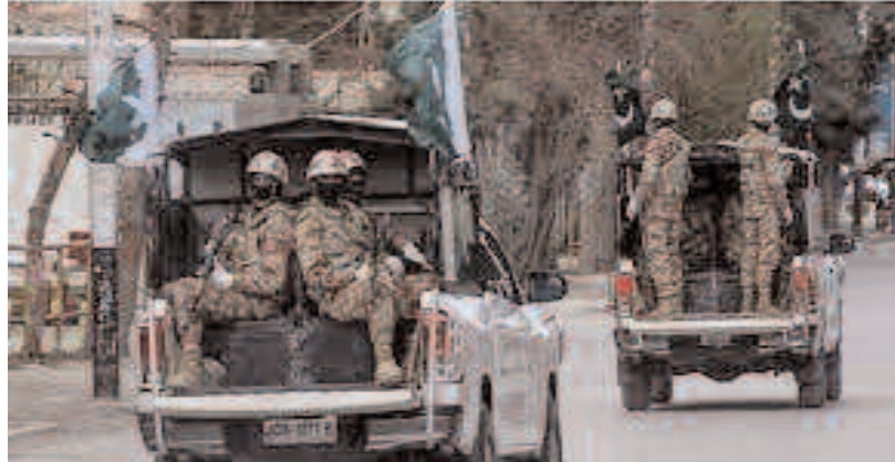
अंतिम चरण में है।

चण्डीगढ़, नवम्बर : पाकिस्तान में एक बड़ा आतंकी हमला हुआ है। मियावाली एयरबेस में कई दहशतगर्दों के घुसने की खबर है। पूरे इलाके में ताबड़तोड़ फायरिंग जारी है. इसके बारे में कई पाकिस्तानी पत्रकारों की रिपोर्ट और वीडियो सामने आए हैं। जहाँ कथित तौर पर अज्ञात बंदूकधारियों ने मियावाली में पाकिस्तानी वायु सेना के प्रशिक्षण अड्डे पर हमला किया है। जिसमें लोग हताहत हुए हैं। सोशल मीडिया पर चल रही खबरों में कहा गया कि पाकिस्तान के पंजाब प्रांत के मियावाली में आज सुबह कई आत्मघाती हमलावरों ने पाकिस्तानी वायु सेना अड्डे पर हमला किया। पाकिस्तान वायु सेना ने कहा कि उन्होंने जवाबी गोलीबारी में तीन आतंकवादियों को मार गिराया।