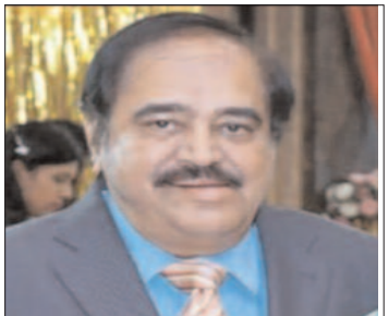
करना देश तथा आमजन का प्रथम दायित्व होगा । अब हमें कोरोना के अलावा वायु प्रदूषण से भी युद्ध स्तर पर जंग करनी होगी । क्योंकि भारत देश विश्व में सर्वाधिक प्रदूषित देश माना जा रहा है ।

करना पड़ेगा । वृक्षारोपण आज पर्यावरण से बचाने की एक बड़ी तथा महती आवश्यकता है । वातावरण में घुली विषैली गैस होने के कारण शहर में मनुष्य का सांस लेना भी मुश्किल होता जा रहा है । विश्व की जलवायु में तेजी से हो रहे परिवर्तन के कारण पर्यावरण असंतुलन का बड़ा कारण वायु प्रदूषण ही है । औद्योगिक प्रगति के साथ-साथ मोटर, रेल, घरेलू, औद्योगिक मशीनें एयर कंडीशन आदि वायु प्रदूषण के लिए अत्यंत खतरनाक माने गए हैं । परिणाम स्वरूप राष्ट्रीय स्तर पर और देश के नागरिकों को ज्यादा से ज्यादा वृक्षारोपण किया जाना होगा और वृक्षों तथा जंगलों की कटाई को तत्काल प्रभाव से प्रतिबंधित किया जाने की तत्काल आवश्यकता है । अन्यथा इसके दुष्परिणाम सामने आने लगेगे तथा इसका सर्वाधिक प्रतिकूल प्रभाव मानव के स्वास्थ्य पड़ेगा । वैश्विक आकलन के अनुसार भारत की विशाल जनसंख्या एक शक्ति तथा बाजार का उपभोक्ता केंद्र है । अतः हमें अपने नागरिकों की जनसंख्या को पर्यावरण प्रदूषण की बलि चढ़ने से रोकना होगा । वायु प्रदूषण का सबसे ज्यादा प्रभाव नौनिहालों और बुजुर्ग व्यक्तियों पर पड़ता है । दोनों की रक्षा