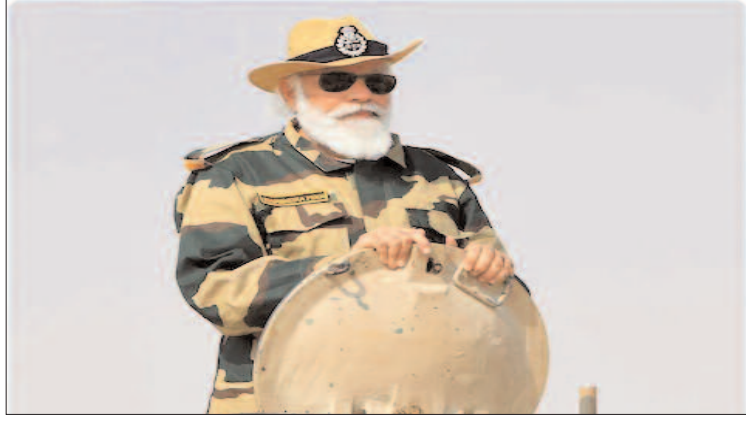
'एक्स' पर लिखा था, "इस दिवाली आइए हम नमो ऐप पर #वोकल फॉर लोकल के साथ भारत की उद्यमशीलता तथा रचनात्मक भावना का जश्न मनाएं."

जम्मू. प्रधानमंत्री नरेंद्र मोदी इस बार दीपावली का त्योहार जवानों के साथ मनाएंगे. बताया जा रहा है कि भारतीय सेना के जवानों के साथ दिवाली का पर्व मनाने के लिए पीएम मोदी जम्मू के अखनूर सेक्टर जा सकते हैं. यह पहली बार नहीं है कि पीएम मोदी दीपावली का त्योहार जवानों के साथ मनाएंगे. पिछले साल भी वे दिवाली के मौके पर कारगिल पहुंचे थे, जहां उन्होंने भारतीय सेना के जवानों संग दीपों के इस पर्व का उत्सव मनाया था. बीते 8 नवंबर को प्रधानमंत्री नरेंद्र मोदी ने लोगों से इस दिवाली स्थानीय स्तर पर विनिर्मित उत्पाद खरीदने और उस उत्पाद या उसके निमाता के साथ एक सेल्फी 'नमो ऐप' पर साझा करने का आह्वान किया है. प्रधानमंत्री मोदी ने सोशल मीडिया मंच