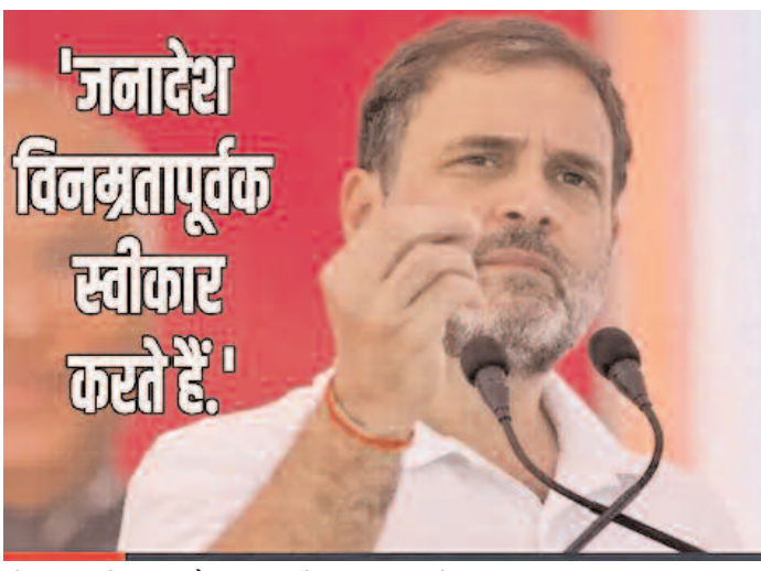
को उनकी मेहनत और समर्थन के लिए दिल से शुक्रिया. हम निरंतर अथक परिश्रम करते रहेंगे.'

नई दिल्ली. चुनावी नतीजों में कांग्रेस पार्टी को भारी नुकसान उठाना पड़ा. राजस्थान में अशोक गहलोत और छत्तीसगढ़ में भूपेश बघेल की सरकार गिर गई. यहां बीजेपी ने बाजी मारी. वहीं, मध्य प्रदेश में सरकार बनाने की आस देख रही पार्टी के तगड़ा झटका लगा है. राहुल गांधी की तरफ से इस शिकस्त पर प्रतिक्रिया आई. उन्होंने कहा कि जनादेश को हम विनम्रतापूर्वक स्वीकार करते हैं. विचारधारा की लड़ाई जारी रहेगी. तेलंगाना में कांग्रेस पहली बार सरकार बनाने जा रही है. इसपर उन्होंने कहा कि प्रजालु तेलंगाना बनाने का वादा हम जरूर पूरा करेंगे. राहुल गांधी ने सोशल मीडिया साइट एक्स पर तीन राज्यों में हार को स्वीकार किया. उन्होंने कहा, ह्यमध्य प्रदेश, छत्तीसगढ़ और राजस्थान का जनादेश हम विनम्रतापूर्वक स्वीकार करते हैं झ विचारधारा की लड़ाई जारी रहेगी. तेलंगाना के लोगों को मेरा बहुत धन्यवाद. प्रजालु तेलंगाना बनाने का वादा हम जरूर पूरा करेंगे. सभी कार्यकर्ताओं