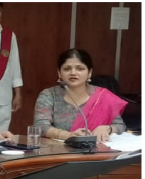
फसल बीमा, निःशुल्क विधिक परामर्श एवं अनेकों अन्य महत्वपूर्ण सेवाएं उपलब्ध कराई जा रही हैं। सस्ती जेनरल दवा उपलब्ध कराने के उद्देश्य से जनपद वाराणसी में आठ, चन्दौली में छः जौनपुर में पांच तथा गाजीपुर में आठ बहुदेशीय प्राथमिक सहकारी समितियों पर सहज जनसेवा केंद्र संचालित हैं, जहाँ बिजली बिल भुगतान, मोबाइल रिचार्ज, केश निकासी, वाराणसी में 6 तथा जौनपुर में 4 केंद्रों को लाइसेंस प्राप्त हो चुके हैं। यही नहीं, वाराणसी की तीन समितियों पर प्रधानमंत्री जन औषधि केंद्र सक्रिय हो चुका है तथा सस्ती जेनरल दवाएं उपलब्ध करायी जा रही हैं।