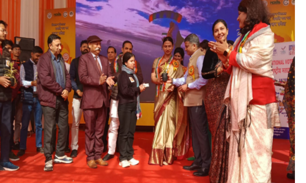
आयु के मतदाता, स्वीप आईकॉन एवं मतदाताओं को जागरूक करने से आधारित पेंटिंग, निबंध एवं रंगोली प्रतियोगिता में स्थान प्राप्त करने वाले छात्रों को भी सम्मानित किया।

जिला निर्वाचन अधिकारी ने इस अवसर पर अपने संबोधन में कहा कि भारत में राष्ट्रीय मतदाता दिवस प्रतिवर्ष 25 जनवरी को भारत निर्वाचन आयोग की स्थापना दिवस के रूप में मनाया जाता है। यह भारत सरकार द्वारा अधिक युवा मतदाताओं को राजनीतिक प्रक्रिया में भाग लेने के लिए प्रोत्साहित करने के लिए स्थापित किया गया था और पहली बार 25 जनवरी 2011 को मनाया गया था। इसी आधार पर हम सब आज 15 बार राष्ट्रीय मतदाता दिवस मना रहे हैं। उन्होंने कहा कि राष्ट्रीय मतदाता दिवस के आयोजन का मुख्य उद्देश्य युवा मतदाताओं में राजनीतिक सक्रियता को जागृत करना तथा निर्वाचन प्रक्रिया में अधिकतम युवाओं को जन भागीदारी सुनिश्चित करना है। उन्होंने कहा हम सबको समान रूप से मताधिकार मिला हुआ है, चाहे कोई अमीर हो या गरीब हो सभी को एक वोट डालने का अधिकार है, इसलिए हमें निर्भीक होकर, धर्म, वर्ग, जाति, समुदाय, भाषा अथवा अन्य किसी भी प्रलोभन से प्रभावित हुए बिना अपने मताधिकार का प्रयोग करना चाहिए। उन्होंने कहा की नई युवा मतदाता जिनका पहली बार मतदाता सूची में नाम जुड़ा है, वह अपने मतदान का प्रयोग अवश्य करें। साथ ही अपने माता-पिता, अभिवावकों,