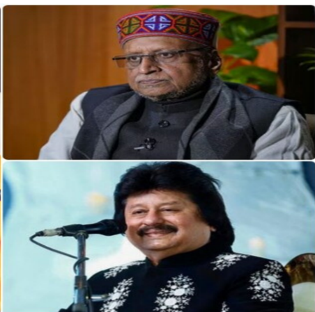
और पूर्व हॉकी गोलकीपर पी आर श्रीजेश को पद्म भूषण से सम्मानित किया गया है.