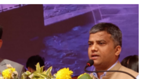
उत्तर प्रदेश दिवस के दूसरे दिन नार्को कोर्डिनेशन सेंटर, विद्युत विभाग, तंबाकू निर्यात प्रकोष्ठ आदि विभागों द्वारा गोष्ठी का किया गया आयोजन संस्कार भारती एवं विभिन्न स्कूलों के बच्चों द्वारा विभिन्न सांस्कृतिक कार्यक्रमों की दी गई प्रस्तुती