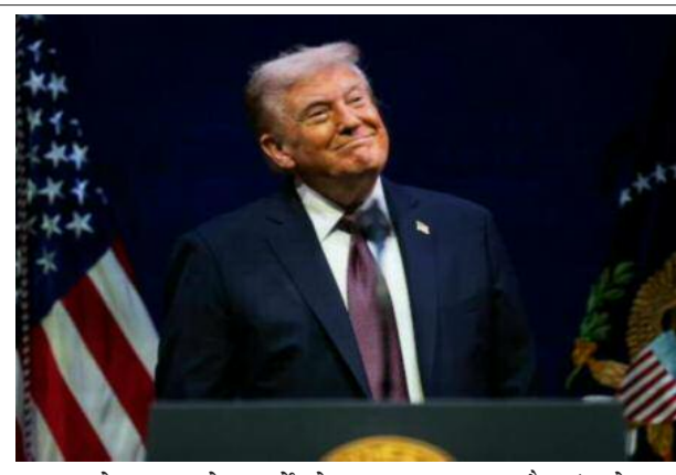
690 करोड़ रुपए) के हजाने को बरकरार रखा है। ट्रंप ने इस

समाज जागरण अमेरिका के राष्ट्रपति डोनाल्ड ट्रंप इन दिनों अपने टैरिफ वॉर से दुनिया में छाप हुए हैं। हालांकि अब कई देश उन्हें आंख दिखा रहे हैं। इस बीच उनका एक और झटका लगा है। दरअसल न्यूयॉर्क की संघीय अपील अदालत ने मानहानि मामले में उन्हें बड़ा झटका दिया है। अदालत ने 81 वर्षीय लेखिका ई. जीन कैरोल की मानहानि मामले में दिए गए 83.3 मिलियन डॉलर (करीब