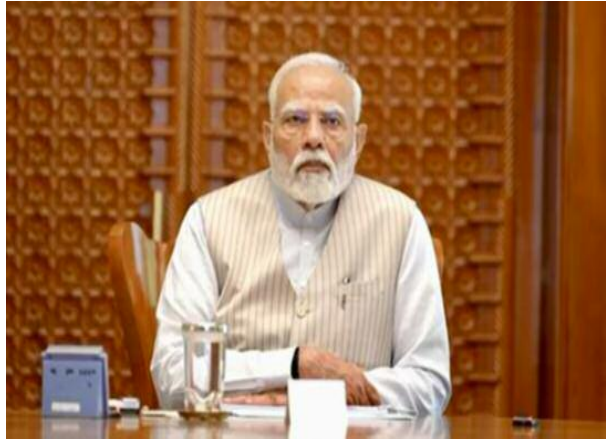
पंजाब में अब धीरे-धीरे स्थिति सामान्य हो रही है। सेना, सीमा

इससे पहले, कृषि मंत्री शिवराज सिंह चौहान ने स्थिति के आकलन के लिए राज्य का दौरा किया था। बाढ़ से हुए नुकसान के आकलन के लिए दो केंद्रीय अंतर-मंत्रालयी टीमों का गठन किया गया है।