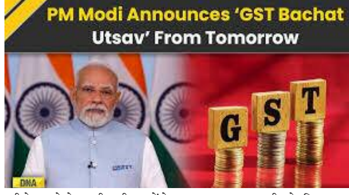
रही नेकस्ट जेनरेशन जीएसटी सुधारों के कारण यह हर भारतीय के लिए 'GST

समाज जागरण प्रधानमंत्री नरेंद्र मोदी ने आज रविवार को देशवासियों को संबोधित करते हुए घोषणा की कि पहले दिन के नवरात्रि से यानी 22 सितंबर से देशभर में "जीएसटी उत्सव" शुरू होगा। उन्होंने इसे हर भारतीय के लिए बचत का त्योहार बताया। प्रधानमंत्री ने कहा कि नई जीएसटी दरों के लागू होने के बाद लोग अपने पर्सदीदा उत्पाद अब कम कीमत में खरीद सकेंगे। प्रधानमंत्री ने कहा, "कल से लागू हो