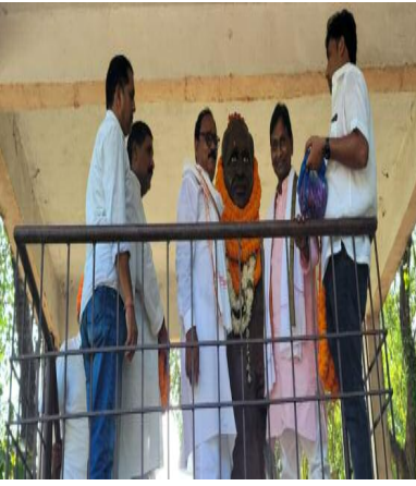
कृतित्व से राष्ट्रीयता में चमक व रहे।

हरहुआ वाराणसी अजगरा विधानसभा क्षेत्र के गोसाईपुर मोहाव में बृथ संख्या 205 अंतर्गत स्थित प० दीन दयाल उपाध्याय के जन्म दिन पर आज गुरुवार को उनकी प्रतिमा पर पूरे समूह के साथ माल्यार्पण कर श्रद्धांजलि अर्पित किया। उन्होंने कहा कि भारतीय जनसंघ केहन विचारक और दार्शनिक थे। प्रखर राष्ट्रवादी, उत्कृष्ट संगठनकर्ता, एकात्म मानववाद और अंत्योदय के प्रणेता एवम हम सबके पथ प्रदर्शक रहे उन्हें भुला पाना कठिन है। उनके व्यक्तित्व व