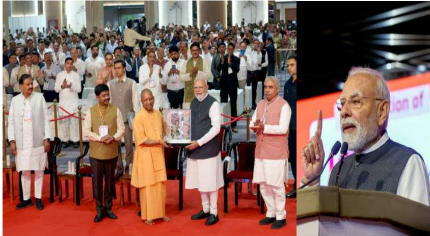
ग्रेटर नोएडा का केंद्र है।

समाज जागरण ग्रेटर नोएडा: प्रधानमंत्री नरेंद्र मोदी ने आज गुरुवार को ग्रेटर नोएडा में आयोजित उत्तर प्रदेश इंटरनेशनल ट्रेड शो 2025 का उद्घाटन किया। इस अवसर पर उन्होंने भारत की तेज विकास यात्रा, आर्थिक सुधारों और आत्मनिर्भरता की आवश्यकता पर जोर दिया। उन्होंने कहा कि भारत को शोध, विनिर्माण और व्यापार में आत्मनिर्भर बनना होगा और इसके लिए निजी निवेश के साथ-साथ एक व्यापक इकोसिस्टम तैयार करना जरूरी है।