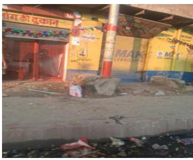
प्रतिदिन निर्धारित समय से पहले ही बिक्री शुरू कर देता है, जिससे विभागीय नियमों की खुली अनदेखी

हरहुआ वाराणसी। बड़गांव थाना क्षेत्र के हरहुआ पुलिस चौकी अंतर्गत ओवरब्रिज के नीचे हरहुआ चौराहे पर स्थित भांग की दुकान आबकारी विभाग के नियमों का उल्लंघन कर रोजाना सुबह 7 बजे ही खुल जाती है। जबकि विभागीय आदेशानुसार भांग, देसी व विदेशी मदिरा तथा बिबर की दुकानें सुबह 10 बजे से रात 10 बजे तक ही संचालित हो सकती हैं। ग्रामीणों ने बताया कि दुकानदार