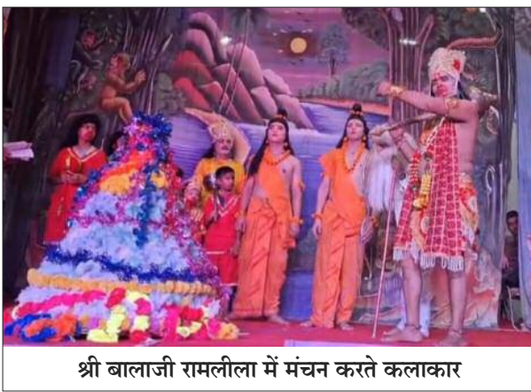
श्री बालाजी रामलीला में मंचन करते कलाकार

बागपत। श्री बालाजी रामलीला कमेटी खेकड़ा के तत्वाधान में चल रही भव्य रामलीला का शुभारंभ श्री बालाजी रामलीला कमेटी खेकड़ा के सभी पदाधिकारियों ने भगवान श्रीराम जी की आरती कर किया। रामलीला के मंचन में आज दिखाया गया कि मेघनाथ लक्ष्मण का भयंकर युद्ध होता है। मेघनाथ लक्ष्मण को अपनी तंत्र विद्या से लक्ष्मण को मूर्छित कर देते हैं। राम, लक्ष्मण को मूर्छित देख वियोग में पड़ जाते हैं, तभी विभीषण जी बताते हैं कि वह लंका से सुषेण वैद्य को अगर ले आए तो लक्ष्मण के प्राण बच सकते हैं। हनुमान जी लंका में जाकर सुषेण वैद्य को ले आते हैं। सुषेण वैद्य लक्ष्मण का उपचार करते हैं और कहते हैं कि अगर सूर्यास्त से पहले मुझे संजीवनी बूटी मिल जाए तो इनके प्राण बच सकते हैं। उधर, रावण को पता लगता है कि लक्ष्मण मूर्छित हो गए हैं और हनुमान जी संजीवनी बूटी लेने गए हैं तो हनुमान जी को रोकने के लिए अपने