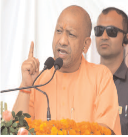
नियंत्रित कर शांति बहाल कर दी।

राष्ट्रीय अपराध रिकॉर्ड ब्यूरो (एनसीआरबी) की 'क्राइम इन इंडिया 2023' रिपोर्ट में उत्तर प्रदेश में कानून-व्यवस्था की स्थिति की तारीफ की गई है। रिपोर्ट के मुताबिक, 2023 में यूपी में सांप्रदायिक और धार्मिक दंगों की संख्या शून्य रही। यह योगी आदित्यनाथ सरकार की 2017 से लागू जीरो टॉलरेंस नीति का परिणाम है। एनसीआरबी के आंकड़ों के मुताबिक, यूपी में अपराध दर राष्ट्रीय औसत से 25 प्रतिशत कम रही। देश में कुल अपराध दर 448.3 थी, जबकि यूपी में यह केवल 335.3 दर्ज की गई। इससे स्पष्ट होता है कि 2017 के बाद उत्तर प्रदेश शांति और सामाजिक सद्भाव का गढ़ बन चुका है।