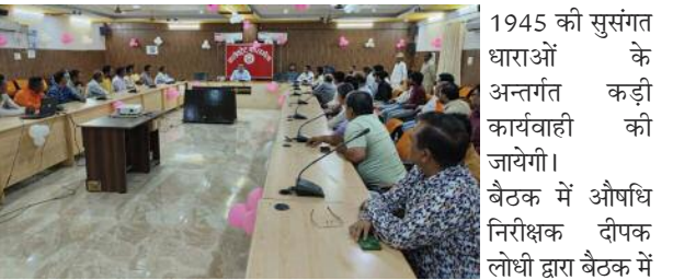
यदि कोई भी दवा व्यवसायी प्रतिबंधित कफ सिरप एवं सोर्ट एक्सपायरी/एक्सपायर दवा का विक्रय करते पाया जाता है तो उसके विरुद्ध औषधि एवं प्रसाधन सामग्री अधिनियम-1940 व नियमावली 1945 की सुसंगत धाराओं के अन्तर्गत कड़ी कार्यवाही की जायेगी। बैठक में औषधि निरीक्षक दीपक लोधी द्वारा बैठक में उपस्थित समस्त दवा विक्रेताओं को जिलाधिकारी द्वारा दिये गये निर्देशों का पालन करने हेतु आदेशित किया गया। बैठक में जनपद के लगभग 70 दवा विक्रेता मौजूद रहे।

समाज जागरण कासगंज: जिलाधिकारी प्रणय सिंह की अध्यक्षता में जनपद कासगंज के दवा विक्रेताओं के साथ बैठक आहूत की गयी। बैठक में जिलाधिकारी द्वारा जनपद के दवा विक्रेताओं को निर्देश दिये गये कि कफ सिरप का विक्रय 05 वर्ष से कम उम्र के बच्चों के उपयोग हेतु न किया जाये। साथ ही उनके द्वारा यह भी निर्देश दिये गये कि जनपद में सोर्ट एक्सपायरी की दवा की बिक्री आम जनमानस को न की जाये।