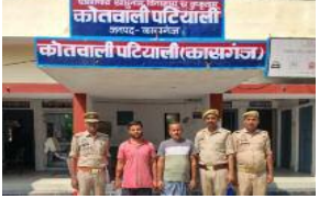
को तरफ से गिरफ्तार करने में सफलता प्राप्त की है। गिरफ्तार अभि0गण के कब्जे से 08 कि0ग्रा0 गोमांस व 01 मोटर साइकिल प्लैटान बरामद हुई है। गिरफ्तारी व बरामदगी के आधार पर थाना पटियाली पर मु0अ0सं0 380/25 धारा 3/5/8 गौवध अधि0 पंजीकृत कर अभि0गण के विरुद्ध नियमानुसार विधिक कार्यवाही करते हुए न्यायिक अभिरक्षा में भेजा गया है।