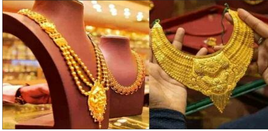
रिटर्न दिया है।

समाज जागरण भारतीय परिवारों के पास मौजूद समय में 34,600 टन गोल्ड मौजूद है और इसकी वैल्यू करीब 3.8 ट्रिलियन डॉलर या जीडीपी के 88.8 प्रतिशत के बराबर है। यह जानकारी मॉर्गन स्टेनली की ओर से शुरूवार को जारी की गई रिपोर्ट में दी गई। बीते एक साल में गोल्ड की कीमतों में 50 प्रतिशत से अधिक की तेजी देखी गई है और यह ऑल-टाइम हाई पर बनी हुई है। रिपोर्ट के मुताबिक, गोल्ड की कीमत अंतरराष्ट्रीय बाजार में 4,056 डॉलर प्रति औंस पर बनी हुई है और घरेलू बाजार में सोने के दाम 1,27,300 रुपए प्रति 10 ग्राम पर पहुंच गए हैं। इस साल की शुरूआत से अब तक सोने ने डॉलर में 54.6 प्रतिशत और रुपए में 61.8 प्रतिशत का