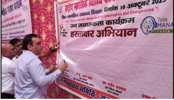
जाए या एजाम का समय स्टूडेंटों परेशान रहते हैं तो इस तरह की अवस्थाओं में मानसिक स्वास्थ्य के लिए काउंसलिंग की आवश्यकता होती है आपके पास ही जिला अस्पताल में मनकक्ष तथा मानसिक रोग चिकित्सा अधिकारी की सुविधा तथा दवाइयां आपको देते हैं।