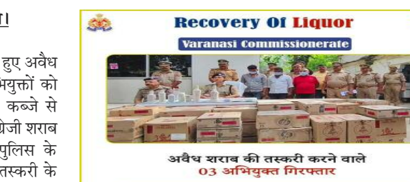
अवैध शराब की तस्करी करने वाले 03 अभियुक्त गिरफ्तार

वाराणसी पुलिस ने बड़ी कार्रवाई करते हुए अवैध शराब की तस्करी में लिप्त तीन अभियुक्तों को गिरफ्तार किया है। पुलिस ने उनके कब्जे से विभिन्न ब्रांड की 135 पीटी अवैध अंग्रेजी शराब और एक ट्रक बरामद किया है। पुलिस के अनुसार, यह शराब अन्य जिलों में तस्करी के