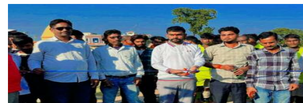
उच्चाधना वनाम बोडेया बस्ती कथारा के बीच खेला गया। जिसमें बोडेया बस्ती कथारा की टीम खेल में एक गोल मारकर विजेता बने।