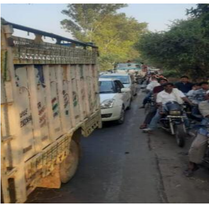
जाने के बाद भी फाटक का बैरियर राहत की सांस ली।

समाज जागरण कांथला। थाना क्षेत्र के बुढ़ाना मार्ग फाटक का अचानक से खराब हो गई फाटक का बैरियर खराब हो जाने से दोनों ओर भीषण जाम लग गया जाम में घंटे वाहन फंसे रहे घंटों के बाद रेलवे विभाग ने फाटक को खुलवाया तब जाकर वाहन स्वामियों ने राहत की सांस ली। शनिवार दोपहर बाद सहारनपुर से दिल्ली जा रही ट्रेन आने के दौरान रेलवे कर्मचारियों ने बुढ़ाना फाटक बंद कर दी। फाटक बंद होने से दोनों ओर वाहन खड़े हो गए। ट्रेन चल