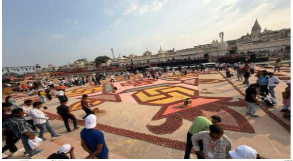
- साल दर साल बढ़ता ही जा रहा धार्मिक पर्यटकों के आने का सिलसिला

1,95,34,824 भारतीय एवं 28,335 विदेशी नागरिकों ने रामनगरी में दर्शन किया। इस प्रकार कुल मिलाकर 1,95,63,159 लोगों ने वर्ष 2018 में अयोध्या में दर्शन-पूजन किया। ऐसे ही वर्ष 2019 में 2,04,63,403 भारतीय एवं 38,321 विदेशी मिलाकर कुल 2,04,91,724 श्रद्धालुओं ने अयोध्या में दर्शन किया। वर्ष 2020 में कोरोना के कारण पर्यटकों की संख्या में कमी देखने को मिली। इस साल 61,93,537 भारतीय एवं 2,611 विदेशी मिलाकर कुल 61,96,148 सैलानी अयोध्या पहुंचे। वहीं वर्ष 2021 में 1,57,43,359 भारतीय एवं 31 विदेशी पर्यटकों ने अयोध्या में दर्शन पूजन किया। 2021 में कुल 1,57,43,390 श्रद्धालु अयोध्या दर्शन के लिए आए। इसी क्रम में वर्ष 2022 में 2,39,09,014 भारतीय एवं 1465 विदेशी पर्यटक अयोध्या पहुंचे। कुल मिलाकर 2,39,10,479 पर्यटक अयोध्या दर्शन के लिए यहां पहुंचे। वर्ष 2023 में भारतीय 5,75,62,428 और 8468 विदेशी पर्यटक आए। इस