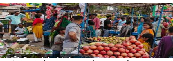
कमाई की उम्मीद है। उनका कहना है कि छठ पूजा के अवसर पर उनकी

सामग्रियों की खरीदारी में व्यस्त हैं। छठ पूजा के लिए आवश्यक सामग्रियों जैसे फल, सूप, नारियल, गन्ना, व्रत के पकवानों और पूजा सामग्रियों की खरीदारी के लिए बाजार में भारी भीड़ देखी जा रही है दुकानदारों को इस वर्ष अच्छी