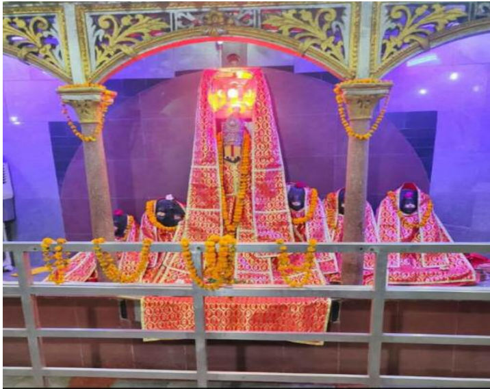
उलार्क मंदिर में स्थापित सूर्य की प्रतिमा

* क्या है मान्यताएं * हिंदुओं का महान धर्मग्रन्थ शांख पुराण के अनुसार ओलार्क सूर्य मंदिर का निर्माण ऋषि गर्ग द्वारा कुछ रोगी होने के लिए दिये गए श्राप से मुक्ति के लिए द्वारकाल में श्रीकृष्ण के जामवंती पुत्र राजा शांब ने कराया था। क्योंकि राजा शांख को गर्ग ऋषि की श्राप से भयंकर कुछ हो गई थी। अपने भयंकर कुछ व्याधि की मुक्ति के लिए भगवान श्री कृष्ण द्वारा सुझाए गए मार्ग के बाद राजा शांब ने गर्ग ऋषि की अपने द्वारा किए गए अपमान की क्षमा मांगते हुए उनसे श्राप मुक्ति के उपाय मांगा था। जिसपर गर्ग ऋषि ने राजा शांख को क्षमा याचना से प्रसन्न होकर भयंकर कुछ व्याधि से मुक्ति के उपाय बताए थे। जिसमें उन्होंने सूर्य उपासना के लिए बाहर अर्क स्थलों की स्थापना कराते हुए बारह अलग अलग जगहों पर सूर्य मंदिर की निर्माण कर वहां सूर्य उपासना करने को कहा था। जिसके बाद राजा शांब ने अपने कुछ व्याधि से मुक्ति के लिए पूरे विश्व में सूर्य उपासना के लिए बारह अर्क स्थलों की स्थापना कराए तथा बारह वर्ष लगातार सूर्य उपासना किया था। उन विश्व के बारह अर्क स्थलों में उलार के ओलार्क, देव के देवार्क, उड़ीसा के कोणार्क, पंडारक