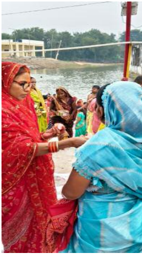
और आस्था का पालन करते हुए

नबीनगर (बिहार) नबीनगर में लोक आस्था का महापर्व छठ व्रत के दूसरे दिन खरना के अवसर पर व्रतियों ने पवित्र पुनपुन नदी में स्नान कर खरना का प्रसाद बनाया। इस दौरान व्रतियों ने नया चावल और गुड़ की बनी खीर, शुद्ध घी में बनी पूड़ी और फल का प्रसाद तैयार किया। इस दौरान व्रतियों ने खीर-पूड़ी का प्रसाद ग्रहण किया। इस दौरान व्रतियों ने बड़ी संख्या में लोगों को प्रसाद ग्रहण करने के लिए आमंत्रित किया, जहां लोगों ने इस प्रसाद को बड़े चाव से ग्रहण किया। छठ पर्व के दौरान व्रती शुद्धता