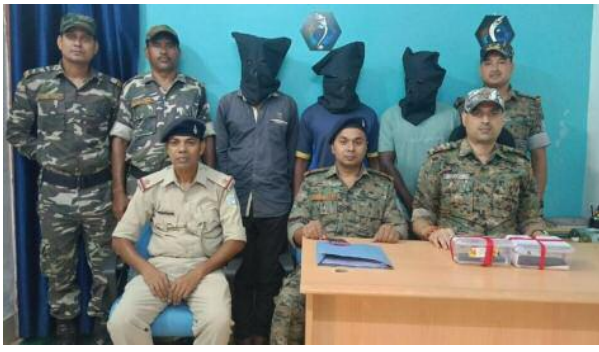
95/25 दिनांक 10 अक्टूबर 2025 का है। ग्राम बेरगाडीह से

सरायकेला खरसावां (झारखंड) : सरायकेला पुलिस ने सीनी ओपी क्षेत्र में घटित ट्रैक्टर चोरी कांड का खुलासा करते हुए तीन चोरों को गिरफ्तार किया है। पुलिस ने उनकी निशानदेही पर चोरी किया गया महिन्द्रा ट्रैक्टर डाला सहित बरामद किया है। साथ ही दो स्कूटी और तीन मोबाइल फोन भी जब्त किए गए हैं। मामला सरायकेला थाना कांड संख्या