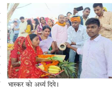
भास्कर को अर्घ्य दिये।

आदिवासी सुनील त्रिपाठी/ समाज जागरण चोपन/ सोनभद्र। पुत्र प्राप्ति, समृद्धि एवं मंगलकामना के महापर्व छठ पर सोमवार की शाम छठ घाट पर सूर्य देव को बड़े ही हार्मोल्लास के साथ अर्घ्य दिया गया। सोन नदी के तट पर छठ पूजा का विशेष माहौल रहा। छठ घाट पर दोपहर से ही छठव्रतियों एवं दर्शनार्थियों के आने का सिलसिला शुरू हो गया था जो चार बजते बजते पूरा छठ घाट खचाखच भर गया। बड़ी संख्या में छठव्रती अपने पूरे परिवार संग गाजे-बाजे के साथ छठघाट पहुंच कर भगवान