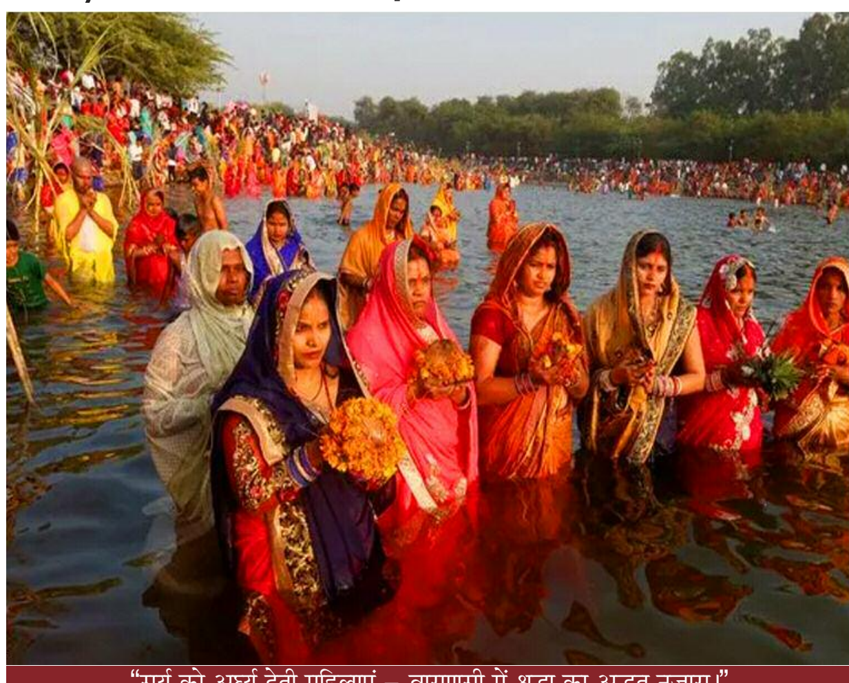
"सूर्य को अर्घ्य देती महिलाएं - वाराणसी में श्रद्धा का अद्भुत नजारा"

नदियों, तालाबों और घाटों पर उमड़ा जनसैलाब - व्रतियों ने संध्या अर्घ्य के साथ मांगी सुख-समृद्धि की कामना