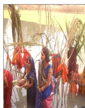
वाराणसी जिले के एंठे गांव स्थित बड़ा तालाब में छठ पूजन करती महिलाएं।