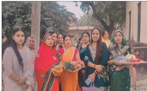
छठ पूजन संपन्न करने के बाद घर वापस जाती महिलाएं।