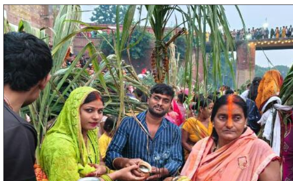
सूर्य देव की आराधना कर आशीर्वाद मांगता परिवार।