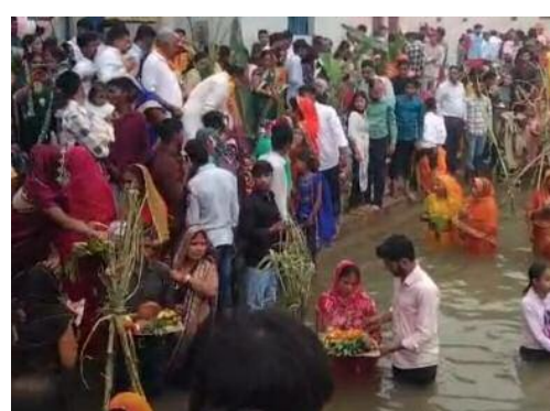
सूर्य देव को नमन किया, तपश्चात् आस्थावानों ने अपने निर्जला उपवास का समापन करते हुए 36 घंटे के निर्जला उपवास का समापन करते हुए अनु ग्रहण करते हैं। जिसे शुद्धता, संयम और भक्ति के साथ किए गए इस कठिन तप के समापन की परंपरा का प्रतीक माना जाता है। इस दौरान घाटों पर पारंपरिक गीतों की धुनें भी गूँजती रही।

लोनी, 28 अक्टूबर: चार दिवसीय लोक आस्था के महापर्व छठ का मंगलवार को भगवान सूर्य को अर्घ्य अर्पित करने के साथ ही समापन हो गया। छठ व्रतियों ने प्रातः पहली किरणों में यमुना नदी व क्षेत्र के विभिन्न स्थानों पर बने घाटों पर खड़े होकर दूध, जल और फल आदि के साथ सूर्य देव को नमन किया, तपश्चात् आस्थावानों ने अपने निर्जला उपवास का समापन करते हुए सूर्य देव को नमन किया, तपश्चात् आस्थावानों ने अपने निर्जला उपवास का समापन करते हुए 36 घंटे के निर्जला उपवास का समापन करते हुए अनु ग्रहण करते हैं। जिसे शुद्धता, संयम और भक्ति के साथ किए गए इस कठिन तप के समापन की परंपरा का प्रतीक माना जाता है। इस दौरान घाटों पर पारंपरिक गीतों की धुनें भी गूँजती रही।