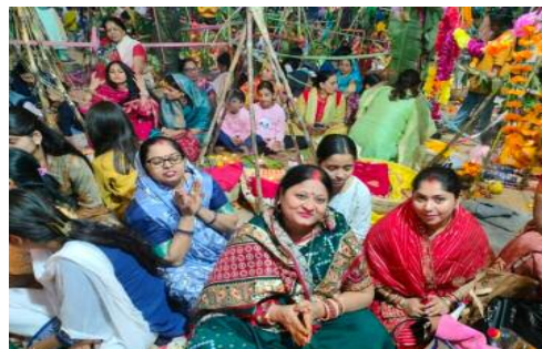
छठव्रतियों ने पूजा, गंगा जल और फल से सूर्य देव को अर्घ्य अर्पित किया। पूजा के उपरान्त पारण कर व्रतियों ने प्रसाद ग्रहण किया और परिवार के सदस्यों के साथ पर्व का समापन किया।

समाज जागरण/संवाददाता नोएडा 28 अक्टूबर 2025 : नोएडा स्टेडियम सेक्टर-21ए स्थित छठ घाट पर मंगलवार की सुबह हजारों छठव्रतियों और श्रद्धालुओं ने उदीयमान भगवान भास्कर को अर्घ्य अर्पित कर चार दिवसीय छठ महापर्व का समापन किया।