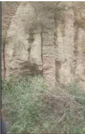
गांव के बुजुर्गों के अनुसार, सैकड़ों