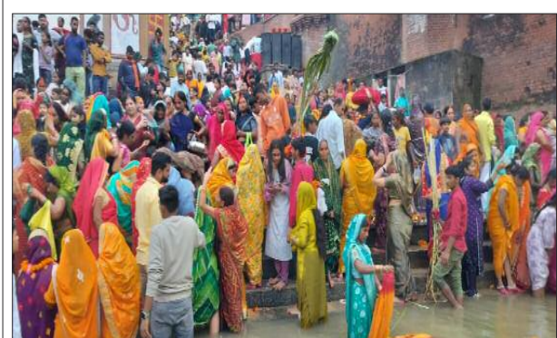
रामेश्वर वरुणा घाट पर अर्घ्य देने पहुंची महिलाओं की भीड़।

36 घंटे तक चलने वाली महाकठिन व्रत छठ पूजन उगते सूर्य को अर्घ्य देकर संपन्न हुआ। मंगलवार को भोर में ही व्रतियों ने नदी और तालाब के किनारे पहुंच कर सूरज का उगने का इंतजार करती नजर आईं जैसे ही भगवान भास्कर का दर्शन हुआ सभी ने अर्घ्य देकर अपना पूजन संपन्न किया।