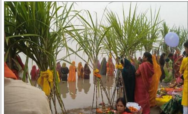
छठ पूजन में चढ़ाए जाने वाले गन्ने (ईख) से पटा नजर आया नदी और तालाब।