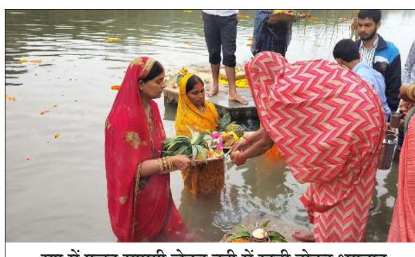
सूप में पूजन सामग्री लेकर नदी में खड़ी होकर भगवान भास्कर को उगने का इंतजार करती महिला।