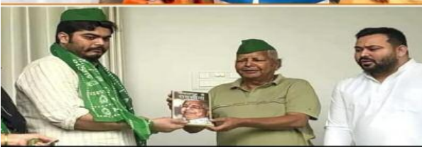
भाजपा ने दी टिकट राम के भजन गाने वाली को RJD ने दी टिकट हत्यारे के बेटे को... अब चुनाव नहीं, चरित्र की परीक्षा होने वाली है!

इंशरॉस देगे राज्य की हर महिला को दिसम्बर से 2500 रुपये देंगे। जीविका दीदीयों को स्थायी कर देंगे। कट्टिकट और आउट सोर्सिंग के कर्मचारियों को स्थायी कर देंगे। विधवा और बुजुर्गों का पेंशन बढ़ाकर 1500 रुपये कर देंगे जिसमें हर साल 200 रुपयों की वृद्धि होती रहेगी। राज्य के भूमिहीन परिवारों को 5 डिजिटल जमीन का मालिकाना हक दिया जायेगा। स्नातकों और स्नातकोत्तरों को हर महिने क्रमशः