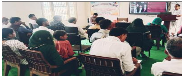
बहल के सीनियर सेकेंडरी स्कूल में आयोजित समावेशी शिक्षा पर जानकारी देते हुए विशेषज्ञ।