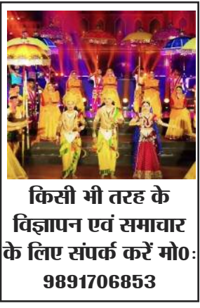
किसी भी तरह के विज्ञापन एवं समाचार के लिए संपर्क करें मो: 9891706853