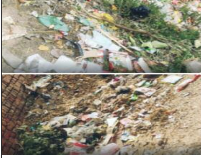
बहल के पटवार कार्यालय क्षेत्र की गली में पसरी गंदगी का दृश्य।

बहल, 29, अक्टूबर। बहल कस्बे के पटवार कार्यालय क्षेत्र में गंदगी का अंबार लगा हुआ है और इसके चलते आम राहगीर व क्षेत्रवासी मुहाल हो रहे हैं। यहां के बाशिनदों का कहना है कि दीपावली त्योहार पर भी उनकी गली में बिखरी पड़ी गंदगी को सफाई करने की ग्राम पंचायत ने जरूरत नहीं समझी। लोगों ने पहले की भांति डस्टबिन टाली खड़ा करने व मौजूदा गंदगी से निजात दिलाने की मांग की है। लोगों ने साफ-सफाई की व्यवस्था ठीक नहीं करवाने को लेकर नाराजगी जताई है। मानसून का वक्त बीत चुका है और इसके बाद मच्छर