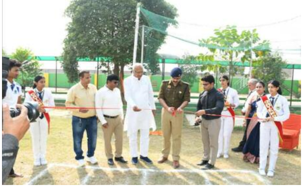
स्वागत किया गया। विद्यालय परिसर को झंडियों, गुब्बारों और पोस्टरों से सजाया गया था। खेल प्रतियोगिताओं में छात्र-छात्राओं ने रस, कबड्डी,