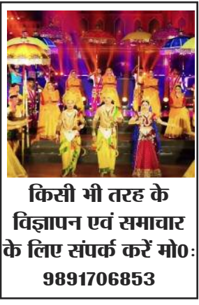
किरी भी तरह के विज्ञापन एवं समाचार के लिए संपर्क करें मो: 9891706853