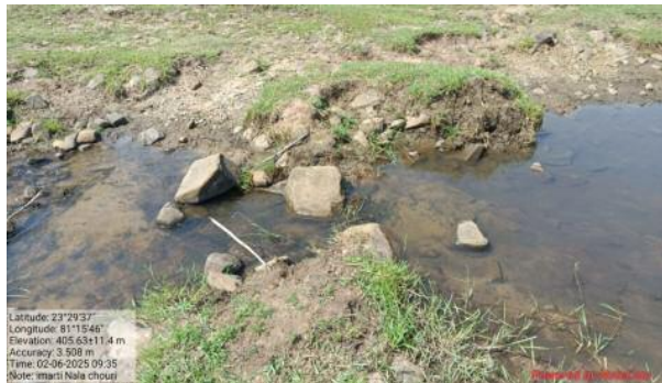
में दीनदयाल उपाध्याय ग्राम ज्योति