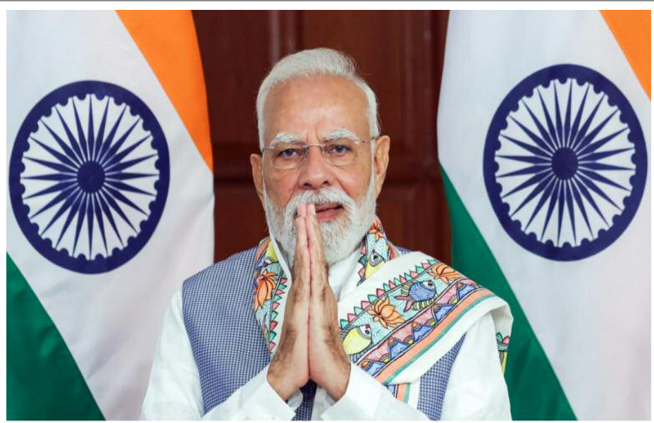
और आसान टीमवर्क के जरिए हमारे देश की क्षमता को बढ़ाया है।

को वैश्विक खेल मानचित्र पर मजबूती से स्थापित किया है। 'वसुधैव कुटुम्बकम्' की भावना के साथ, हम इन ऐतिहासिक खेलों को अद्भुत उत्साह के साथ मनाने के लिए उत्सुक हैं। हम दुनिया का स्वागत करने के लिए उत्सुक हैं।" केंद्रीय गृह मंत्री अमित शाह ने लिखा, "भारत के अहमदाबाद में 2030 कॉमनवेलथ गेम्स की मेजबानी करने की प्रतिष्ठित बोली जीतने पर प्रत्येक देशवासी को बधाई। यह प्रधानमंत्री नरेंद्र मोदी के भारत को एक ग्लोबल स्पोर्ट्स हॉटस्पॉट बनाने के विजन का सबूत है। एक दशक से ज्यादा की मेहनत के बाद, पीएम मोदी ने वर्ल्ड-क्लास स्पोर्ट्स इन्फ्रास्ट्रक्चर बनाया है और असरदार गर्वनेस