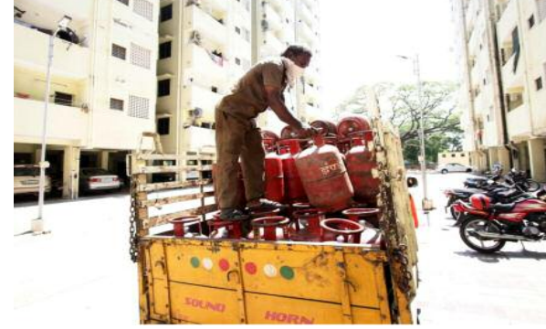
वर्ष 25 में 4.5 प्रति वर्ष तक पहुंच गई है। इसकी वजह कम दाम, बेहतर डिलीवरी नेटवर्क और रोजाना खाना पकाने की ऊर्जा जरूरतों के लिए एलपीजी पर बढ़ती निर्भरता है।

समाज जागरण भारत की एलपीजी खपत बीते आठ वर्षों में 44 प्रतिशत बढ़कर वित्त वर्ष 25 में 31.3 मिलियन मीट्रिक टन (एमएमटी) हो गई है, जो कि वित्त वर्ष 17 में 21.6 एमएमटी थी। यह जानकारी बुधवार को जारी एक रिपोर्ट में दी गई। रिपोर्ट के मुताबिक, परिवारों की ओर से बड़ी संख्या में रिफिल भराने और एलपीजी तक आम जनता की पहुंच आसान होने के कारण मांग में लगातार इजाफा हो रहा है और यह वित्त वर्ष 26 तक 33-34 एमएमटी तक पहुंच सकती है।