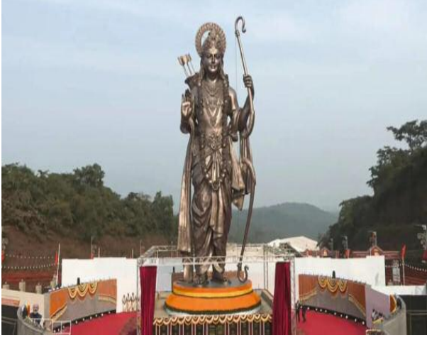
अपने संबोधन में प्रधानमंत्री ने कहा कि भारत इस समय एक सांस्कृतिक और आध्यात्मिक पुनरुत्थान के दौर से गुजर रहा है।

समाज जागरण गोवा, 29 नवंबर 2025: प्रधानमंत्री नरेंद्र मोदी ने शुक्रवार को दक्षिण गोवा के कानकोना क्षेत्र में स्थित श्री संस्थान गोकर्ण जीवोत्तम मठ के 550वें वर्ष समारोह के अवसर पर भगवान श्रीराम की 77 फुट ऊंची कांसे की भव्य मूर्ति का अनावरण किया।