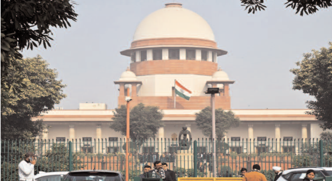
सीबीआई को पूर्ण सहयोग देने का निर्देश भी दिया गया। दी है, उन्हें आईटी एक्ट के तहत जांच के लिए सहमति देने का निर्देश दिया गया ताकि पूरे देश में व्यापक कार्रवाई सुनिश्चित

सुप्रीम कोर्ट ने आज सोमवार को देशभर में डिजिटल-अरेस्ट स्कैम से जुड़े मामलों की जांच के लिए सीबीआई को स्वतंत्र रूप से कार्रवाई करने का आदेश दिया। चीफ जस्टिस सुर्यकांत की अगुवाई वाली बेंच ने स्पष्ट किया कि सीबीआई एफआईआर न होने पर भी उन खतों को फ्रीज कर सकती है जिनका इस्तेमाल साइबर अपराधों और फ्राँड में किया गया हो। सुप्रीम कोर्ट ने कहा कि डिजिटल-अरेस्ट स्कैम देश की प्रमुख जांच एजेंसी का तत्काल ध्यान खींचता है, इसलिए सीबीआई को सबसे पहले इन मामलों की जांच करने का निर्देश दिया गया है।