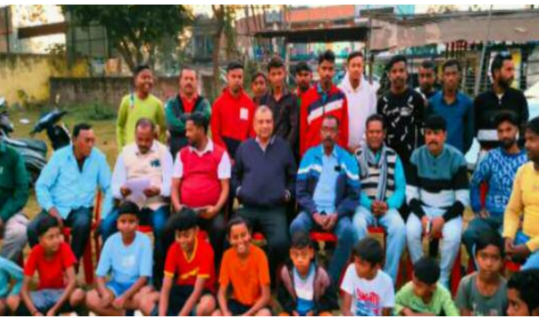
चतुर्थ पुरस्कार: 2,50,000 एवं ट्रॉफी फुटबॉल प्रतियोगिता के साथ-साथ दुसू मेला का भी आयोजन किया जाएगा।

अभय कुमार मिश्रा, दैनिक समाज जागरण, ब्यूरो चीफ, कोल्हान झारखंड सरायेकेला खरसावां (झारखंड) 04 दिसम्बर 2025: आदिवासी तिलका फुटबॉल एसोसिएशन कोलाबीरा द्वारा वर्ष 2026 में तीन दिवसीय फुटबॉल प्रतियोगिता एवं विराट दुसू मेला के आयोजन की घोषणा की गई है। यह कार्यक्रम 31 जनवरी, 1 फरवरी एवं 2 फरवरी 2026 को आयोजित होगा प्रतियोगिता में कुल 16 टीमों भाग लेंगी। आयोजकों ने बताया कि एंटी फीस 65,000 रुपये निर्धारित की गई है।