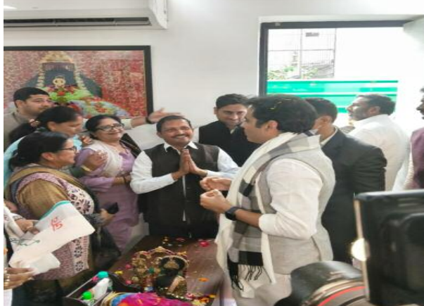
शुभकामनाएं व्यक्त कीं और उनके कामना की।