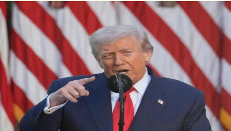
नजर आती है।

अमेरिका के यूरोपीय साझेदारों पर भी यूक्रेन में शांति स्थापित करने के प्रयासों में बाधा डालने का आरोप लगाया गया है, जबकि कहा जाता है कि यूरोप की जनता युद्ध समाप्त करने का समर्थन करती है। एनएसएस अपने एक प्रमुख उद्देश्य के रूप में यूरोप और रूस के बीच रणनीतिक स्थिरता की पुनर्स्थापना की आवश्यकता को रेखांकित करती है। आश्चर्य नहीं कि रूस ने एनएसएस का स्वागत किया है क्योंकि यह उसके हितों के अनुरूप