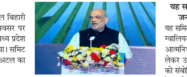
इकाइयों में 2 लाख करोड़ रुपए से अधिक का निवेश प्रस्तावित है, जिससे करीब 2 लाख लोगों को रोजगार मिलने की संभावना है। गृह मंत्री ने इसे अटल बिहारी वाजपेयी के सुशासन और राष्ट्र निर्माण के सपने को सच्ची श्रद्धांजलि बताया।

समाज जागरण पूर्व प्रधानमंत्री और भारत रत्न अटल बिहारी वाजपेयी की 101वीं जयंती के अवसर पर मुख्यमंत्री योगी आदित्यनाथ ने 'अभ्युदय मध्य प्रदेश ग्रोथ समिट' का आयोजन किया गया। समिट का विषय था- 'निवेश से रोजगार: अटल का संकल्प, उज्ज्वल मध्य प्रदेश'।