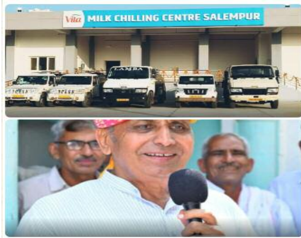
को उनके द्वारा शिलान्यास किया गया था। इस चिलिंग सेंटर की 20 हजार लीटर प्रतिदिन दुग्ध संग्रहण क्षमता है। भविष्य में इसे बढ़ाकर 40-50 हजार लीटर प्रतिदिन दुग्ध संग्रह