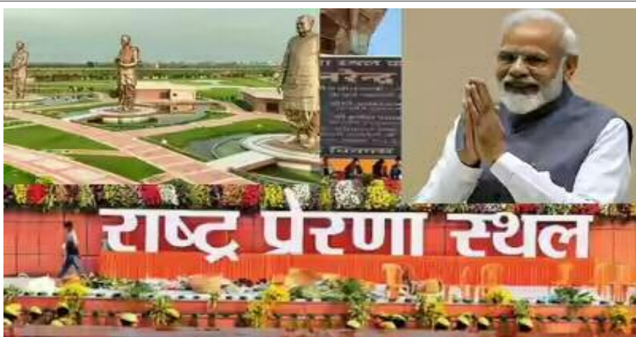
राष्ट्र प्रेरणा स्थल के निर्माण के लिए मुख्यमंत्री योगी आदित्यनाथ को दी बधाई

समाज जागरण प्रधानमंत्री नरेंद्र मोदी ने बुधवार को राष्ट्र प्रेरणा स्थल के लोकार्पण समारोह में कहा कि वह दिन दूर नहीं, जब उत्तर प्रदेश का डिफेंस कॉरिडोर पूरी दुनिया में अपनी पहचान बनाएगा। उन्होंने इसे उत्तर प्रदेश के लिए एक ऐतिहासिक उपलब्धि बताते हुए कहा कि आने वाले समय में राज्य का डिफेंस कॉरिडोर वैश्विक मानचित्र पर मजबूती से उभरेगा।