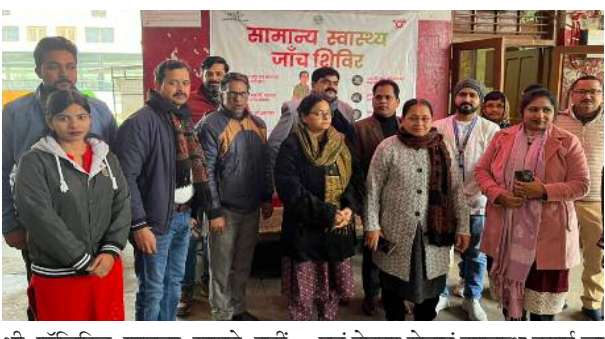
भी पॉजिटिव मामला सामने नहीं आया। इसके अतिरिक्त शिविर में 35 लोगों का एक्स-रे, 32 का स्पुटम परीक्षण तथा 30 लोगों का नेत्र परीक्षण भी किया गया। सीएमओ ने बताया कि इस शिविर का मुख्य उद्देश्य परिवहन सेवाओं से जुड़े कर्मियों के स्वास्थ्य की समय रहते जांच कर उन्हें स्वस्थ रखना है, जिससे यात्रियों को भी सुरक्षित