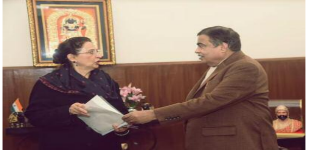
को '500 करोड़ की अटैची' वाले विवादित बयान के चलते पार्टी से बाहर का रास्ता दिखाया गया था। राजनीतिक गलियारों में

समाज जागरण चंडीगढ़: हाल ही में कांग्रेस पार्टी से निलंबित की गई डॉ. नवजोत कौर सिद्धू ने केंद्रीय मंत्री नितिन गडकरी की जमकर तारीफ की है। नवजोत कौर ने न केवल सोशल मीडिया पर गडकरी की कार्यशैली की सराहना की, बल्कि उनसे मुलाकात कर अमृतसर की सड़कों और हाइवे से जुड़ी गंभीर समस्याओं को भी उठाया। सिद्धू