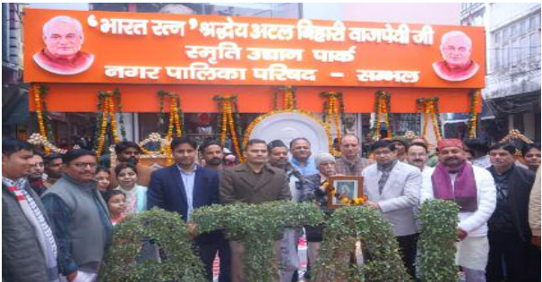
विकसित यह पार्क बच्चों, महिलाओं एवं वृद्धजनों के लिए विश्राम व भ्रमण का बेहतर स्थल बनेगा तथा नई पीढ़ी को राष्ट्रबोध, लोकतांत्रिक मूल्यों व सुशासन की प्रेरणा देगा। इस अवसर पर भाजपा जिलाध्यक्ष हरेंद्र सिंह रिक्कू, सभासदगण,

समाज जागरण संभल। सुशासन सप्ताह (19 से 25 दिसंबर 2025) के अंतिम दिन एवं भारत रत्न पूर्व प्रधानमंत्री स्व. अटल बिहारी वाजपेयी की जयंती/जन्म शताब्दी वर्ष के समापन अवसर पर नगर पालिका परिषद संभल द्वारा अटल स्मृति पार्क का लोकार्पण किया गया। जिलाधिकारी डॉ. राजेन्द्र पैंसिया के निर्देशन में नगर पालिका के अधिशासी अधिकारी/उप नगर आयुक्त डॉ. मणि भूषण तिवारी द्वारा अंतिममण मुक्त कर विकसित किए गए इस पार्क का लोकार्पण जिलाधिकारी डॉ. पैंसिया एवं पुलिस अधीक्षक कृष्ण कुमार बिस्नोई ने किया। भीड़भाड़ वाले बाजार क्षेत्र में