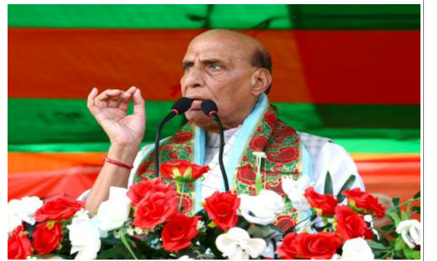
बढ़ रही है। उन्होंने कहा कि आज पूरी दुनिया कान खोलकर सुनती है कि भारत क्या बोल रहा है और यह प्रधानमंत्री नरेंद्र मोदी के नेतृत्व में देश की बढ़ती ताकत का प्रमाण है।

समाज जागरण रक्षा मंत्री राजनाथ सिंह ने राष्ट्र प्रेरणा स्थल के उद्घाटन समारोह में मुख्यमंत्री योगी आदित्यनाथ को इस भव्य परियोजना के लिए बधाई दी। उन्होंने कहा कि डॉ श्यामा प्रसाद मुखर्जी ने भारत की एकता और अखंडता के लिए लंबा संघर्ष किया और धारा 370 के विरोध में अपने प्राणों का बलिदान दिया। उन्होंने कहा कि