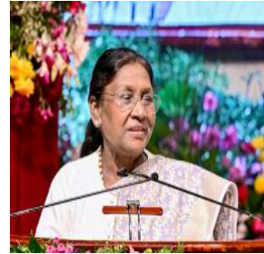
युवा वीरों के साहस, बलिदान और अनुकरणीय मूल्यों को किया जाएगा स्मरण केंद्र सरकार के अनुसार, वे पुरस्कार वीरता, कला एवं संस्कृति, पर्यावरण, सामाजिक

समाज जागरण शुक्रवार, 26 दिसंबर को देशभर में राष्ट्रीय स्तर पर वीर बाल दिवस मनाया जाएगा। इस अवसर पर विभिन्न क्षेत्रों में असाधारण उपलब्धियां हासिल करने वाले बच्चों को प्रधानमंत्री राष्ट्रीय बाल पुरस्कार (पीएमआरबीपी) से सम्मानित किया जाएगा। यह पुरस्कार राष्ट्रपति द्रौपदी मुर्मू नई दिल्ली में आयोजित एक विशेष समारोह में प्रदान करेंगी। कार्यक्रम के माध्यम से भारत के