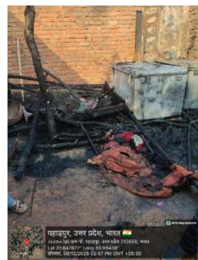
गया- वेड़, गेहूं, चावल, धानकपड़े, सिलाईमशीन, बक्सा, बर्तन,

नहीं थे। घर में केवल छोटे-छोटे बच्चे खेल रहे थे। इसी दौरान अचानक आग भड़क उठी और देखते ही देखते पूरा घर आग की लपटों में छिर गया। ग्रामीणों के जुटने और कड़ी मशकत के बाद आग पर नियंत्रण पाया गया, लेकिन तब तक गरीब परिवार की वर्षों की जमा पूंजी और गृहस्थी का लगभग सारा सामान जलकर खाक हो चुका था। आग में घर के गृहस्थी सहित छोटे भाई की शादी का सारा सामान भी नष्ट पीड़ित परिवार ने बताया कि आग में निम्न सामान पूरी तरह नष्ट हो