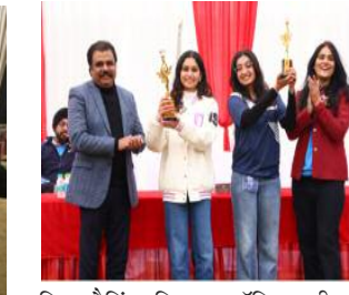
गिफ्ट रैपिंग, क्विज, कॉमिक स्ट्रीप, फूड कार्विंग, शिल्पकार, डिबेट,