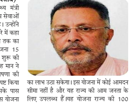
का लाभ उठा सकेगा। इस योजना में कोई आमदन सीमा नहीं है और यह राज्य की आम जनता के लिए उपलब्ध है। यह योजना राज्य की 100

जैतो, 2 जनवरी : पंजाब के स्वास्थ्य मंत्री डॉ. बलबीर सिंह ने शुक्रवार को स्वास्थ्य सेवाओं को लेकर एक महत्वपूर्ण बयान दिया है। उन्होंने मुख्यमंत्री सेहत योजना की घोषणा के बारे में कहा कि पंजाब के हर परिवार को 10 लाख तक का मुफ्त कैंसर इलाज देने वाली योजना 15 जनवरी 2026 को औपचारिक रूप से शुरू की जाएगी। पंजाब के मुख्यमंत्री भगवंत सिंह मान ने दिसंबर 2025 में इस योजना की घोषणा की थी। स्वास्थ्य मंत्री डॉ. बलबीर सिंह ने स्पष्ट किया कि पंजाब का कोई भी निवासी जिसके पास आधार कार्ड और वोटर कार्ड है, वह इस योजना का लाभ उठा सकेगा। इस योजना में कोई आमदन सीमा नहीं है और यह राज्य की आम जनता के लिए उपलब्ध है। यह योजना राज्य की 100