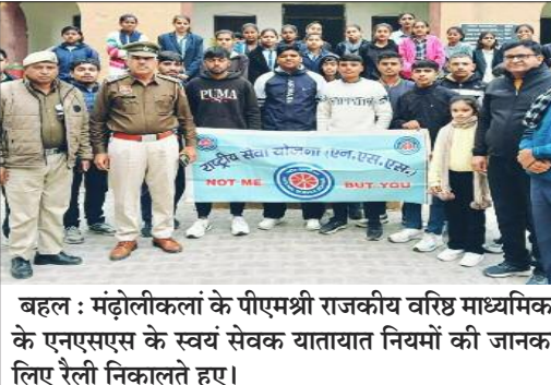
बहल : मंडोलीकला के पीएमश्री राजकीय वरिष्ठ माध्यमिक विद्यालय के एनएसएस के स्वयं सेवक यातायात नियमों की जानकारी देने के लिए रैली निकालते हुए।