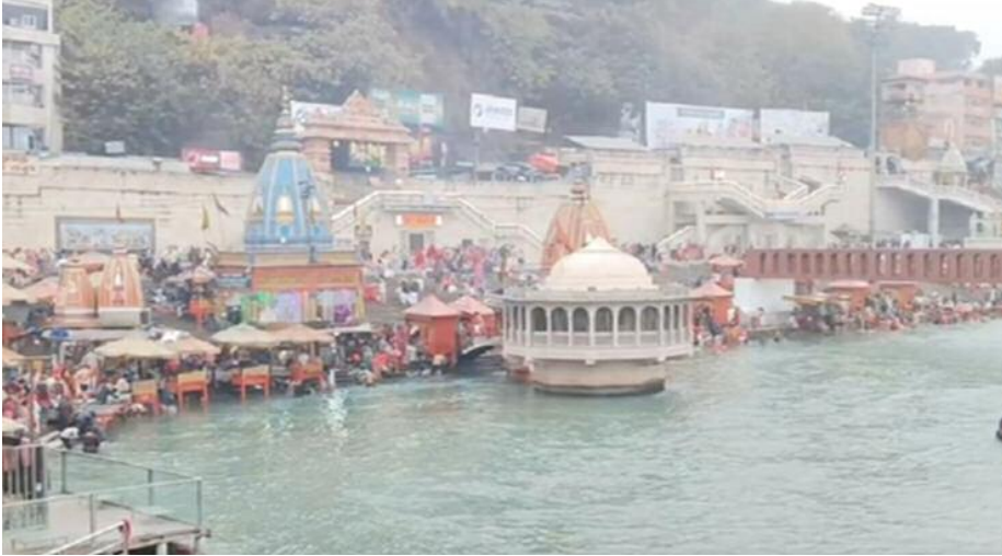
भक्तों की संख्या मौसम खराब होने के बावजूद बनी रही, प्रशासन ने चेंजिंग रूम, अलाव और कैम्प की व्यवस्था कर लोगों की सुविधा सुनिश्चित की

समाज जागरण पवित्र माघ महीने की शुरुआत शनिवार से हो गई है। पौष पूर्णिमा और माघ मेले की शुरुआत के साथ ही श्रद्धालु भारी संख्या में पवित्र नदियों में स्नान करने पहुंच रहे हैं। कड़कड़ाती सर्दियों में भी सुबह से ही वाराणसी और हरिद्वार में श्रद्धालु अपने पितृ पक्ष की शांति के लिए घाटों पर पूजा-पाठ भी कर रहे हैं। वाराणसी में सर्दी, कोहरा और हल्की बारिश के बावजूद श्रद्धालु घाटों पर स्नान और पितरों के अनुष्ठान कर रहे हैं वाराणसी में आज सुबह से मौसम कई रंग दिखा रहा है। सर्द हवा के साथ कोहरा और हल्की बूंदा भूतों की वजह से सर्दी का वितम बढ़ गया है, लेकिन इससे श्रद्धालुओं की आस्था पर कमी देखने को नहीं मिल रही है। 11 डिग्री के तापमान और हल्की बारिश में भी घाटों पर भक्त